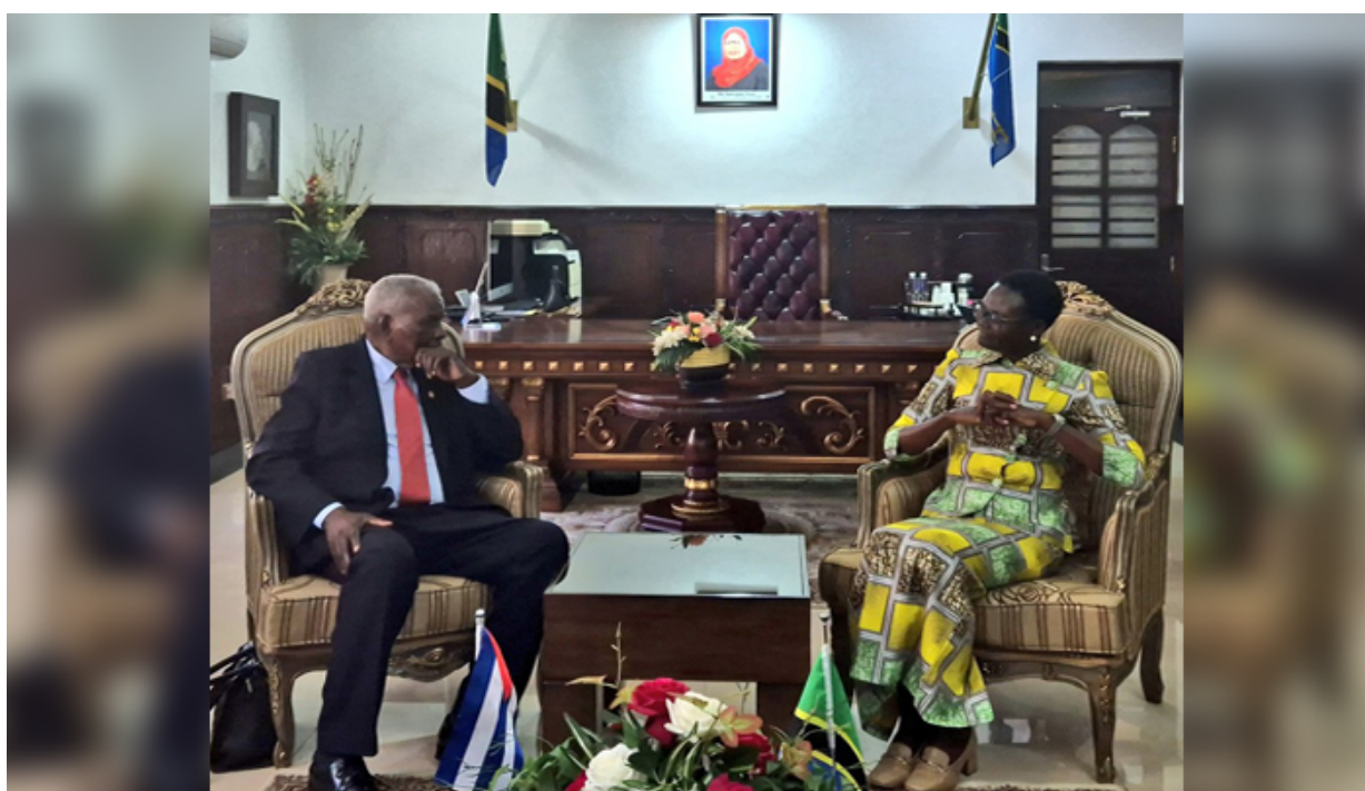
Esteban Lazo y Tulia Ackson

La Habana, 6 mar (RHC) El miembro del Buró Político y presidente de la Asamblea Nacional del Poder Popular y del Consejo de Estado, Esteban Lazo Hernández, fue recibido por la Titular de la Asamblea Nacional de Tanzania y presidenta de la Unión Interparlamentaria IPUparliament, Tulia Ackson, en Dar es-Salam.