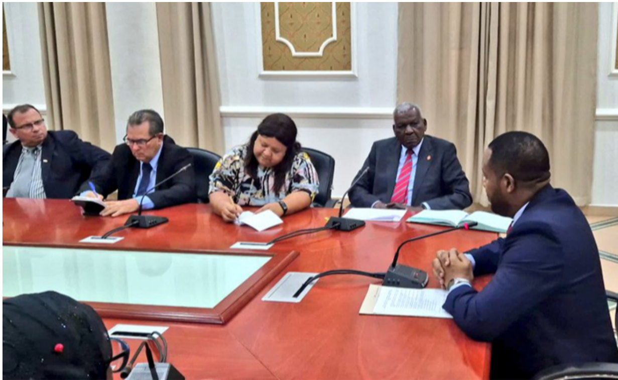
Esteban Lazo y Zubeir Ali Maulid

Posteriormente, Lazo Hernández se reunió con Zubeir Ali Maulid, titular de la Cámara de Representantes de Zanzíbar, para promover la cooperación interparlamentaria y el intercambio de experiencias legislativas.