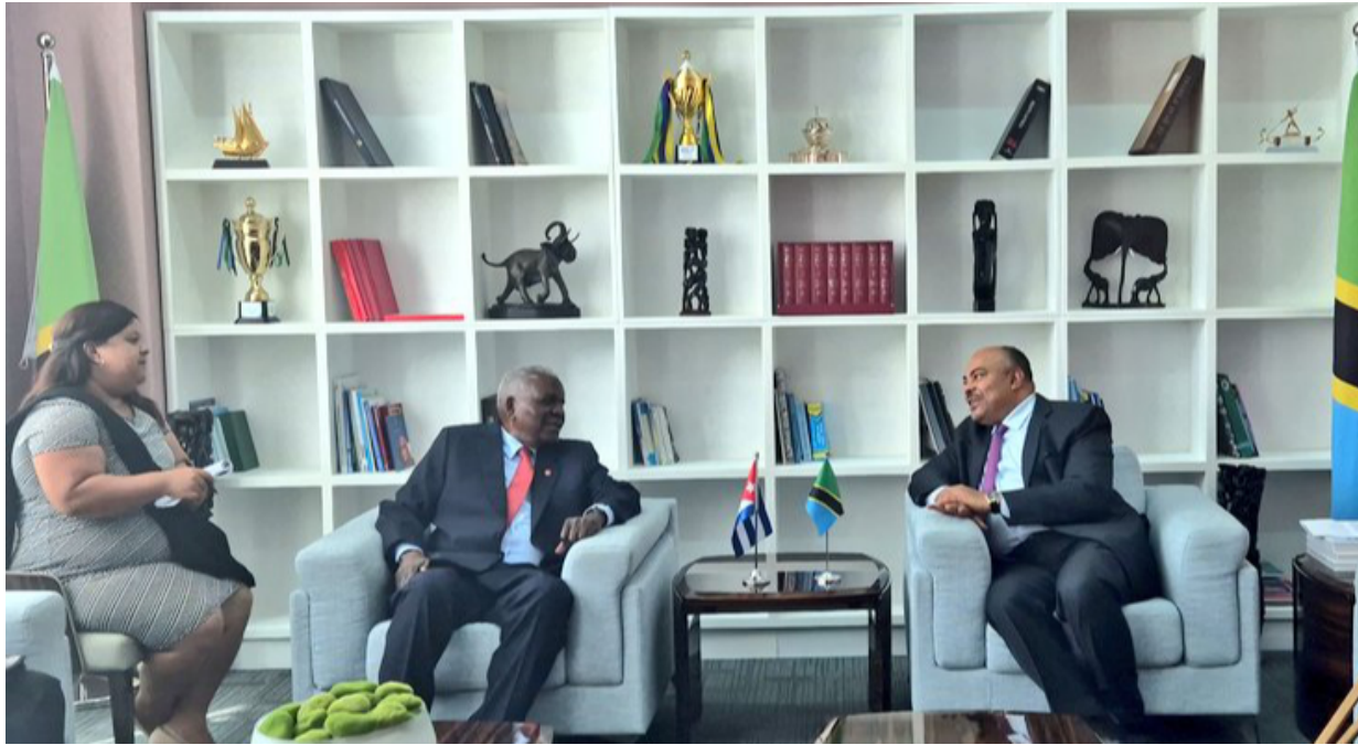
Esteban Lazo y Mahmoud Thabit Kombo

El Presidente de la Asamblea de Cuba, también dialogó con el ministro de Asuntos Exteriores y Cooperación del África Oriental de la República Unida de Tanzania, Excmo. Sr. Mahmoud Thabit Kombo.