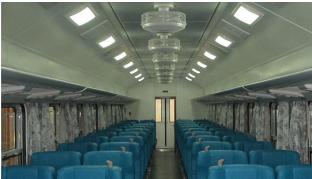
Coche tipo 2: sistema de audio, 12 ventiladores de techo, 72 asientos reclinables y giratorios, dos baños, bebedero de agua fría.