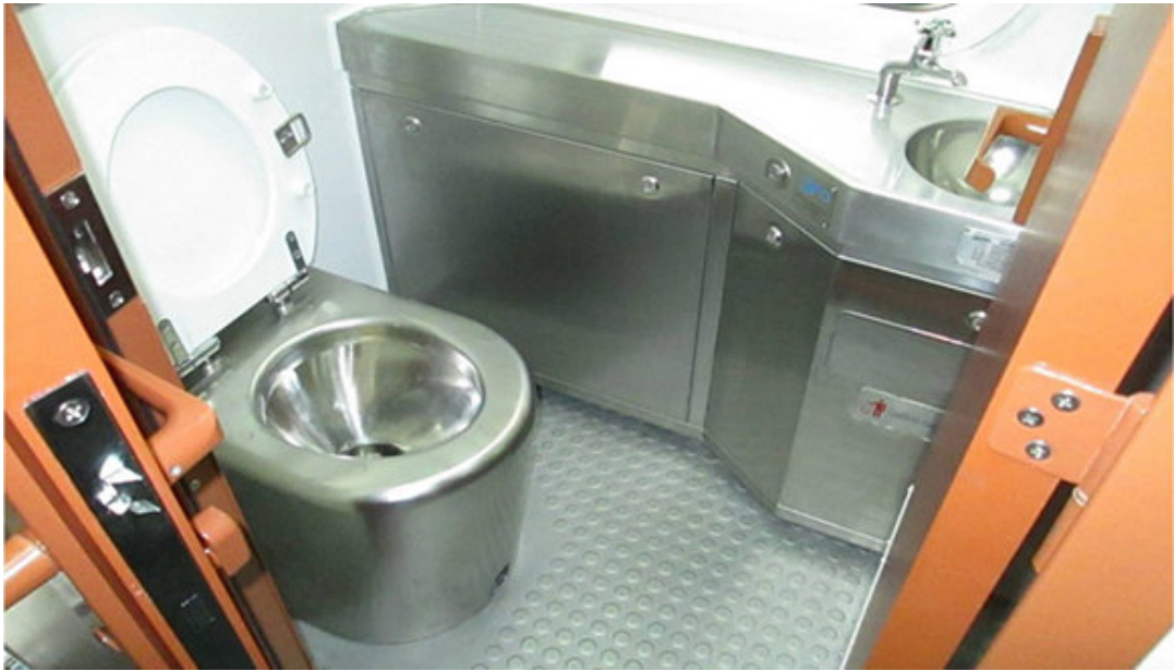
Área sanitaria.