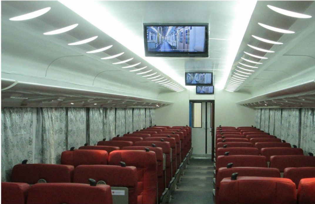
Coche tipo 1: sistema de televisión y video, sistema de climatización, capacidad: 72 asientos reclinables y giratorios, dos baños, bebedero de agua fría.

La información recibida por parte de Ferrocarriles de Cuba también señala que los nuevos trenes son de formación mixtas; es decir, que cuentan con dos tipos de coches, unos con aire acondicionado y otros con ventanilla. Las nuevas comodidades estarán acompañadas de cambios en las tarifas de viajes, las cuales se informarán con posterioridad.