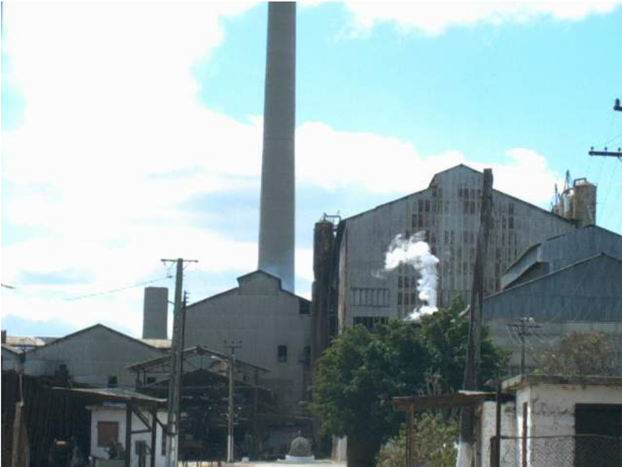
Central Ciro Redondo.

Ramiro Valdés comprobó durante su recorrido la calificación y capacitación de la fuerza contratada. De igual forma insistió en trabajar en la biomasa forestal, lo que permitirá producir más azúcar y a la vez ahorrar combustible al país. (Fuente: RRebelde ).