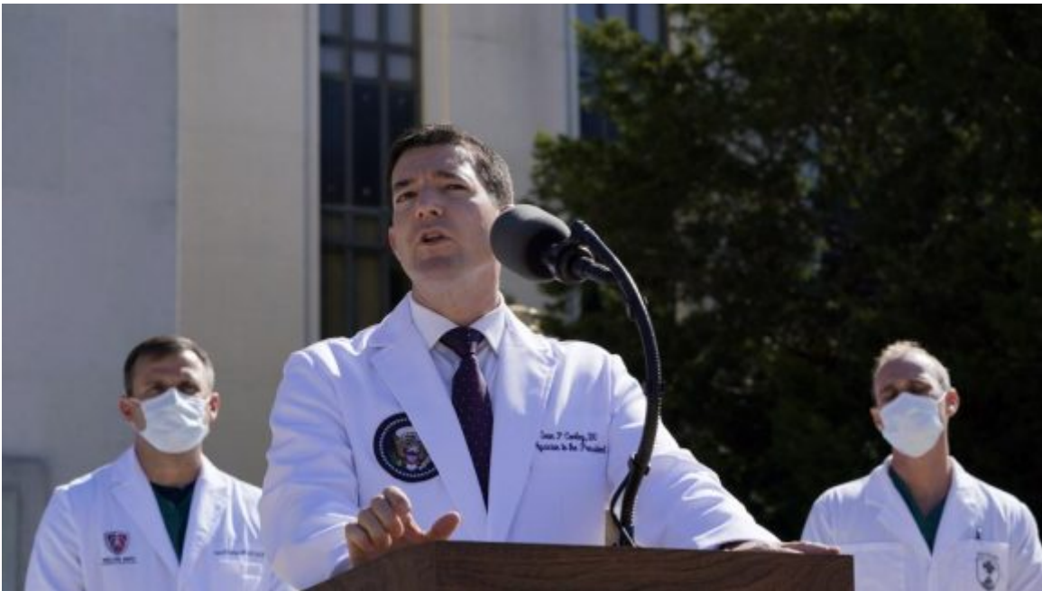
Sean Conley, médico de Donald Trump.

Las pruebas de COVID pueden ser caras. Aunque normalmente cuestan $ 100, una sala de emergencias en Texas ha cobrado hasta $ 6,408 por una prueba de manejo. Aproximadamente el 2,4% de las pruebas de coronavirus facturadas a las aseguradoras dejan al paciente responsable de una parte del pago, según la firma de datos de salud Castlight. Con 108 millones de pruebas realizadas en los Estados Unidos, eso podría equivaler a millones de pruebas que dejan a los pacientes responsables de una parte del costo.