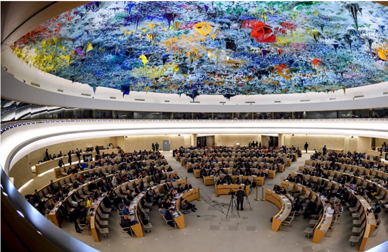
Consejo de Derechos Humanos de la ONU.

Son los mismos que presentan a Estados Unidos, promotor del rechazo a la propuesta de Cuba a integrar la CDH, como modelo de acatamiento de las libertades esenciales.