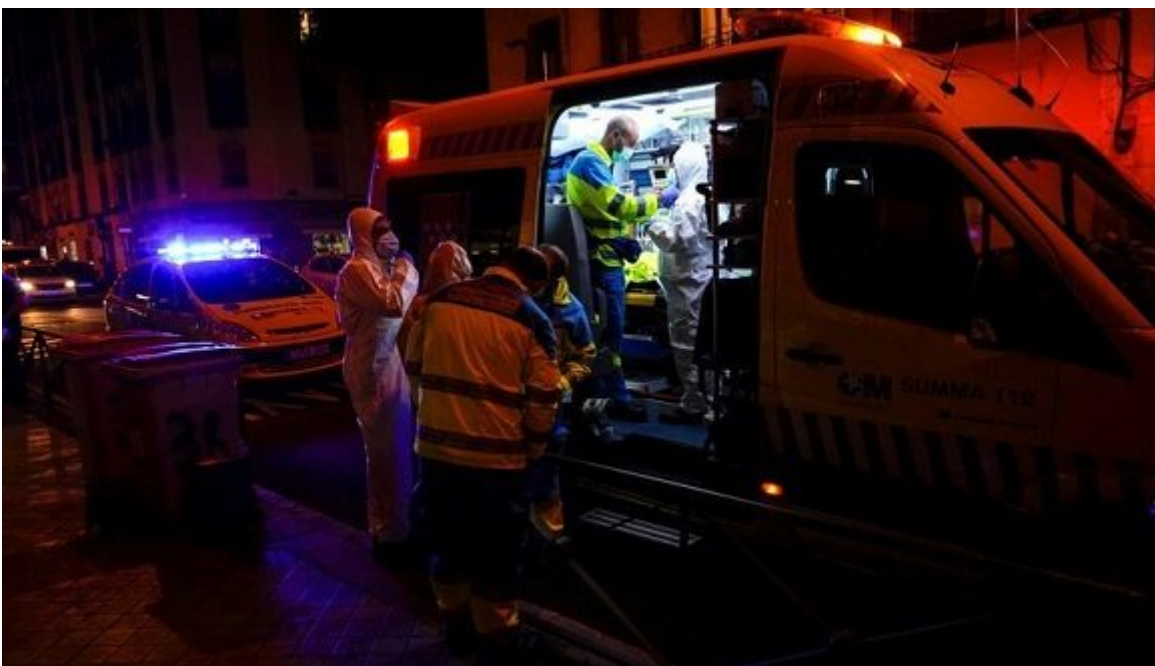
Madrid durante la pandemia de COVID-19.

El coronavirus se está propagando incluso más rápido que durante la primera fase de la pandemia, dijo este viernes un asesor del Gobierno francés, mientras las autoridades de todo Europa vuelven a tomar medidas cada vez más estrictas para tratar de contener la nueva ola de contagios en el continente.