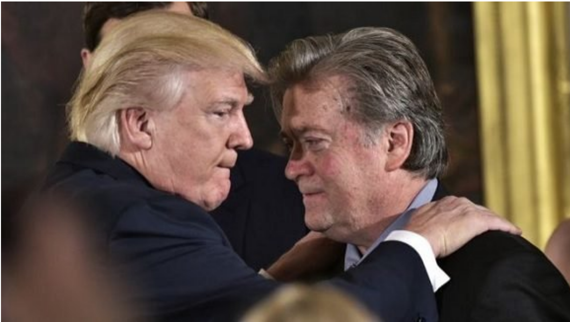
Steve Bannon y Donald Trump.

Twitter suspendió permanentemente una cuenta perteneciente al exestratega jefe de la Casa Blanca, Steve Bannon, luego de que sugiriera el jueves por la mañana que el Dr. Anthony Fauci y el director del FBI, Christopher Wray, deberían ser decapitados. Sus comentarios se hicieron en un video publicado en sus cuentas de Facebook, YouTube y Twitter.