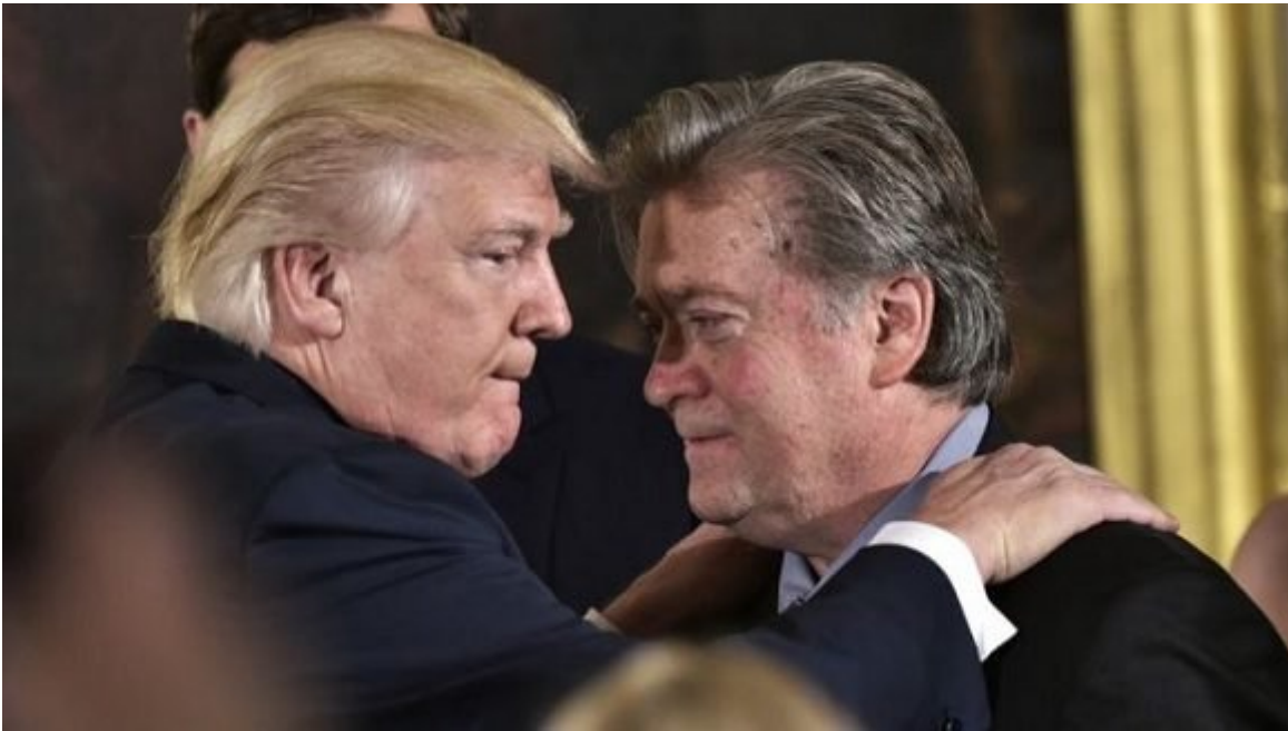
Steve Bannon y Donald Trump.

Twitter suspendió permanentemente una cuenta perteneciente al exestratega jefe de la Casa Blanca, Steve Bannon, luego de que sugiriera el jueves por la mañana que el Dr. Anthony Fauci y el director del FBI, Christopher Wray, deberían ser decapitados. Sus comentarios se hicieron en un video publicado en sus cuentas de Facebook, YouTube y Twitter.