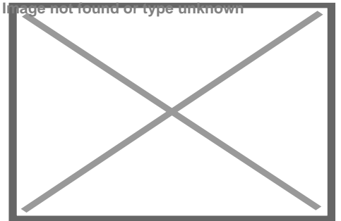
Relojero hotel Globo

https://www.radiohc.cu/index.php/de-interes/caleidoscopio/244272-hotel-el-globo-y-su-reloj-cautiva-a-todos-fotos