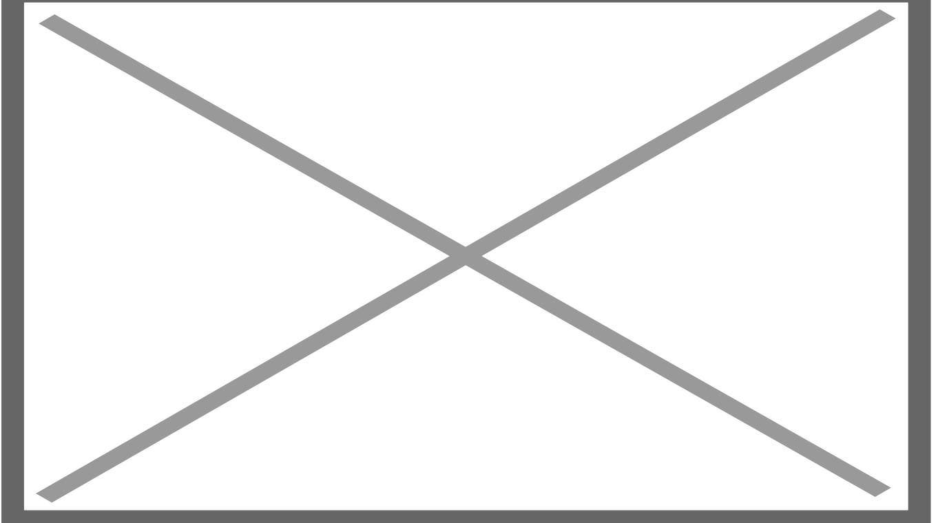
escultura de cavernícola

La Habana, 18 enero- Una peculiar obra de arte que representa un cavernícola dentro un gran bloque de hielo apareció en el Parque Theodore Wirth de la ciudad estadounidense de Minneapolis (Minnesota), atrayendo el interés de muchos residentes locales.