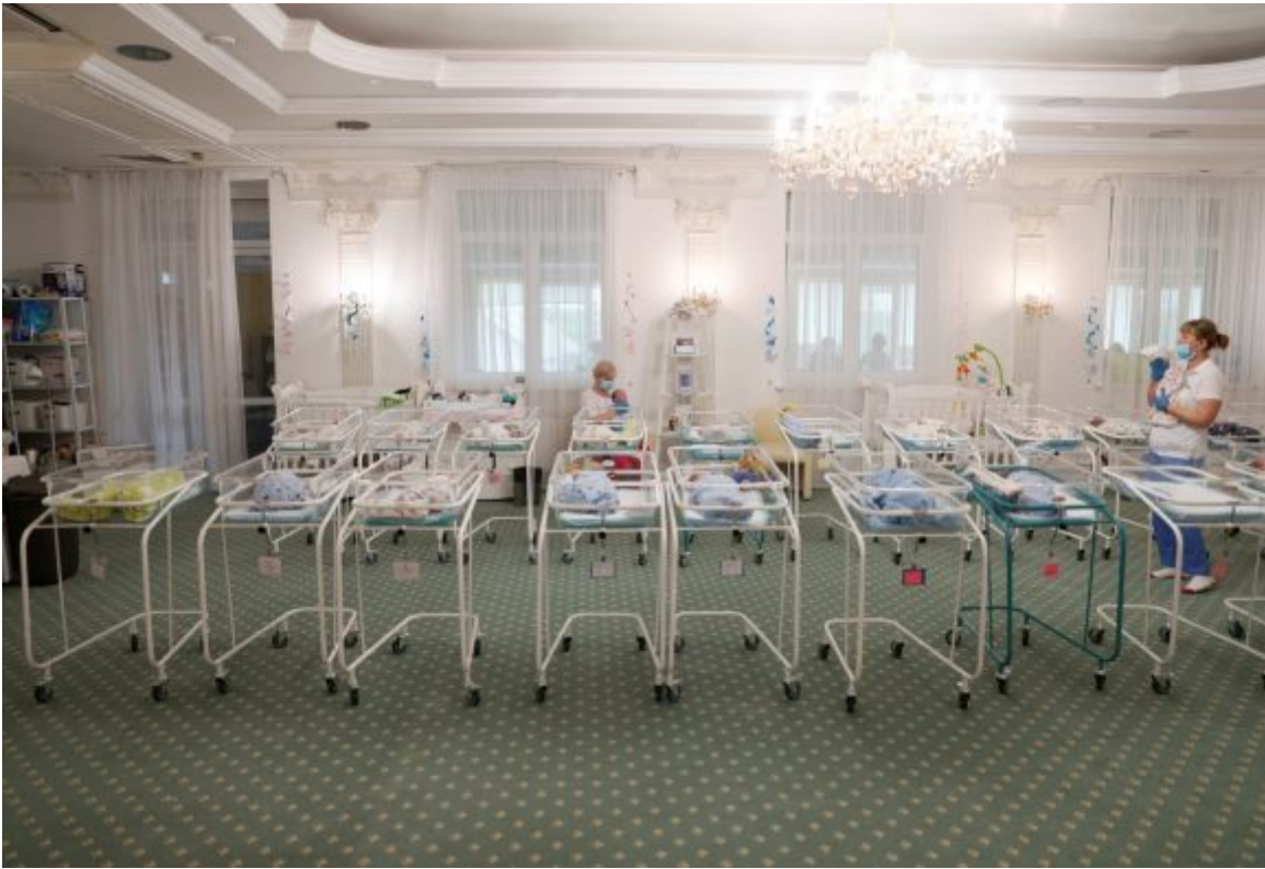
Bebés en el Hotel Venecia, propiedad de la clínica BioTexCom en Kiev, Ucrania. Este centro utiliza espermatozoides donados para la fecundación in vitro y la gestación subrogada.