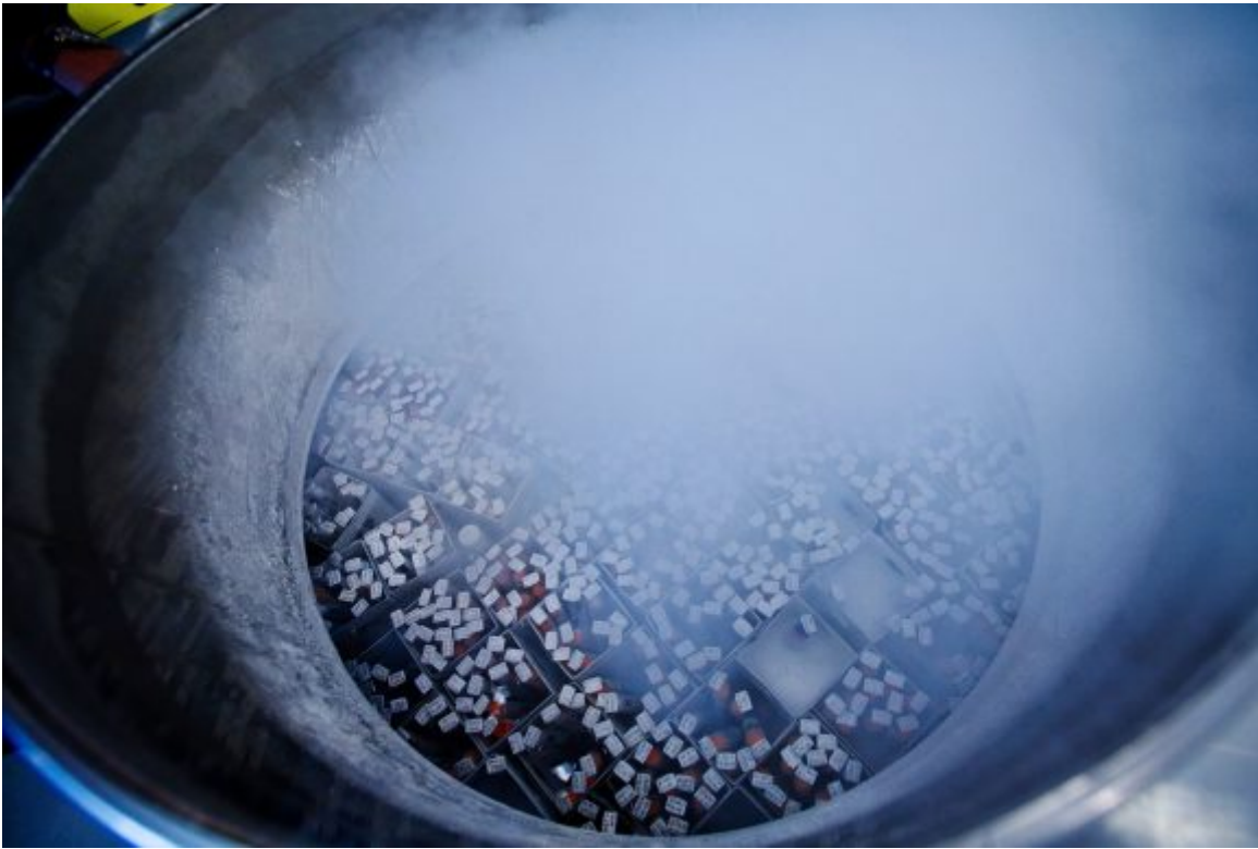
Frascos de esperma congelados en una instalación de Cryobank, en California.