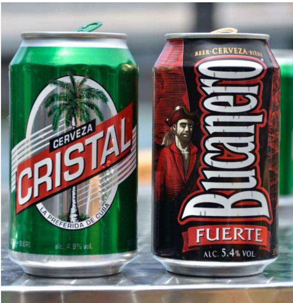
Es en particular la Cristal de Cuba la marca más demandada.

La planta que elabora la Cristal de Cuba, la Cervecería Bucanero S.A., en la oriental provincia de Holguín, celebró el 24 de octubre pasado sus 30 años.