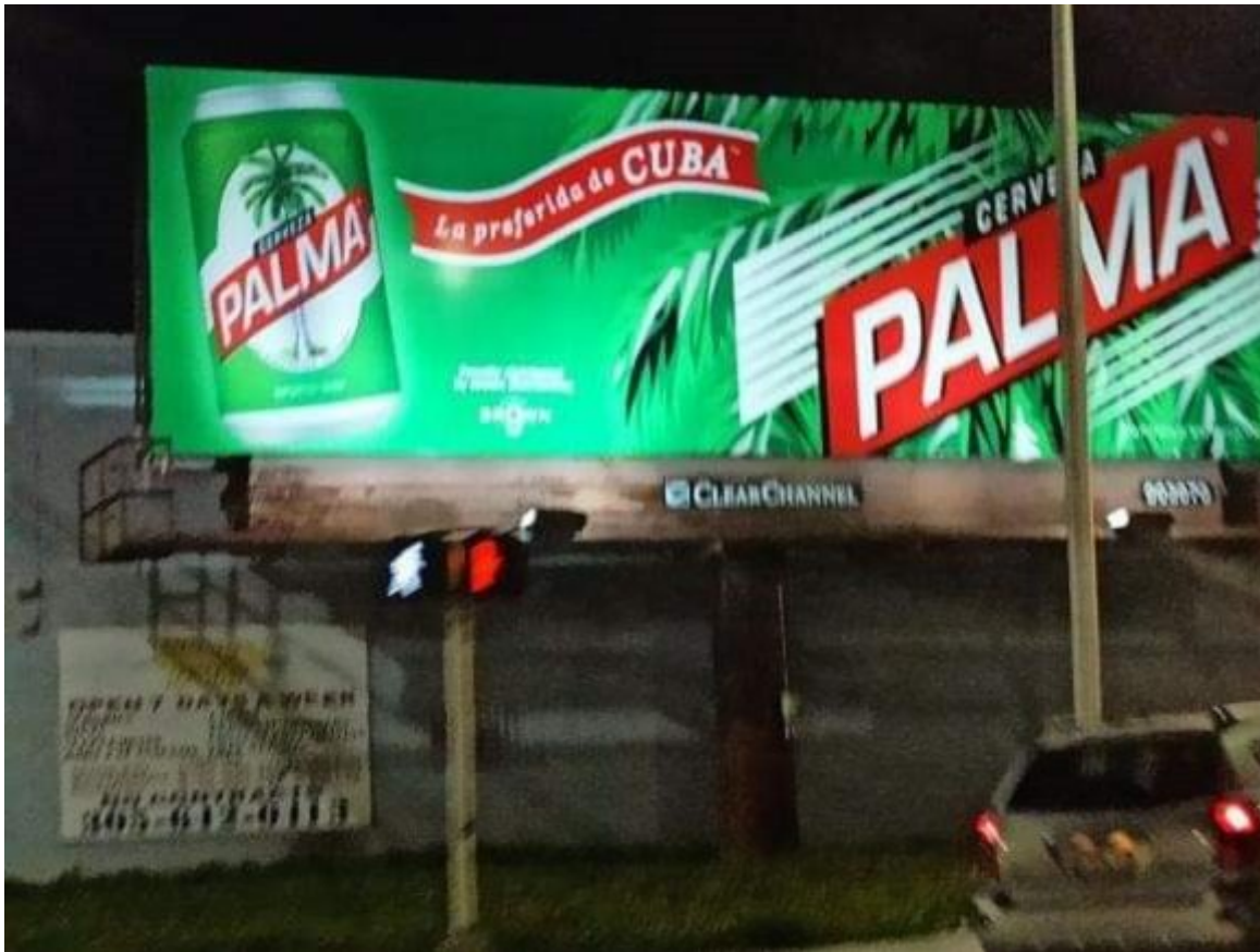
Publicitan la cerveza Palma en una calle de Miami.

Es en particular la Cristal de Cuba la marca más demandada, tanto por nacionales como por visitantes extranjeros, lo que permite suponer en cuanto a la Palma de Miami una intención de plagio, y fórmula para confundir al consumidor.