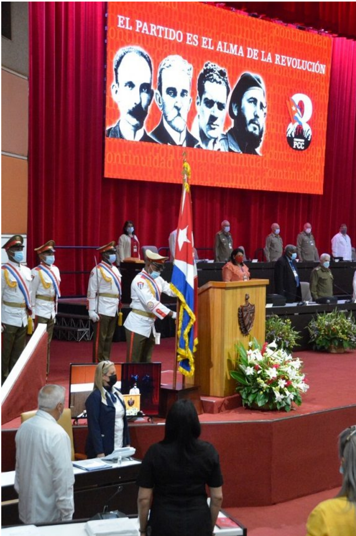
Se aprecian ineficiencias en la planificación y seguimiento y en algunos caso acciones lentas y tardías para corregir las desviaciones.