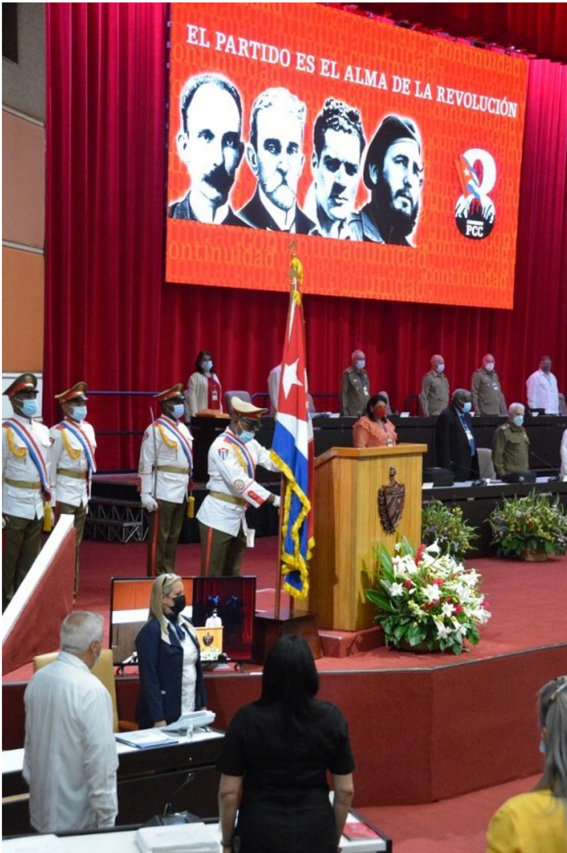
Se aprecian ineficiencias en la planificación y seguimiento y en algunos caso acciones lentas y tardías para corregir las desviaciones.