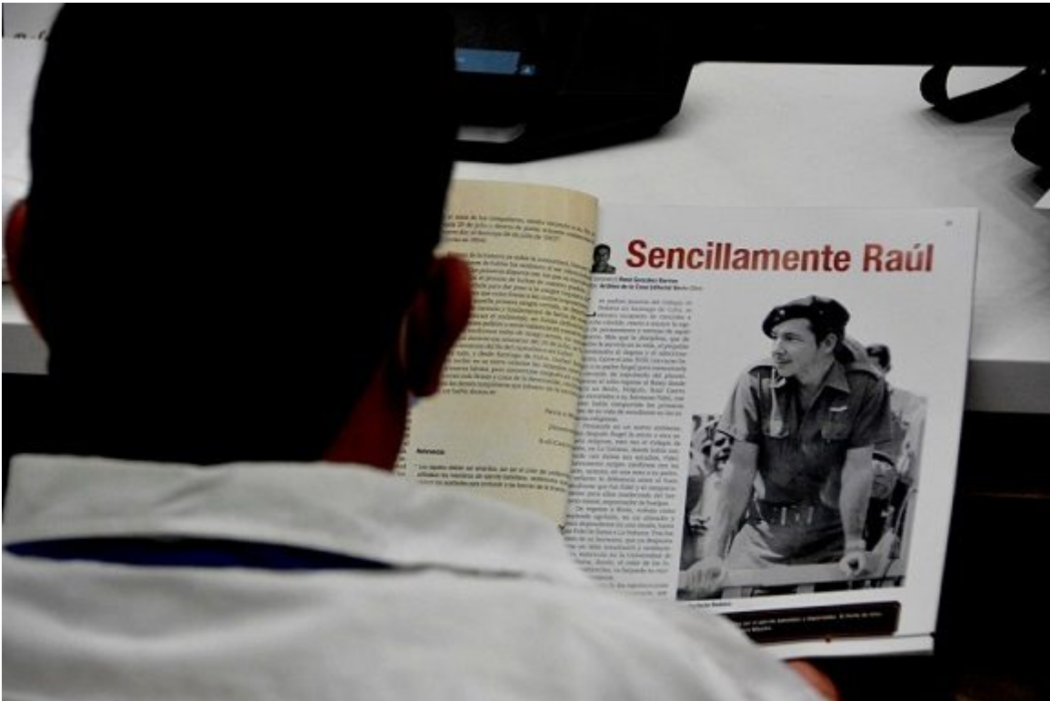
Delegados en la sesión plenaria del 8vo. Congreso del Partido.

Estas circunstancias, prosiguió, demandan una transformación en el terreno ideológico y especificó que en materia de política de cuadros se ha trabajado en los acuerdos del Congreso del Partido, al tiempo que se ha avanzado en la concepción en materia organizativa y los cargos decisorios y un incremento de jóvenes, mujeres, negros y mulatos, sobre la base de méritos personales.