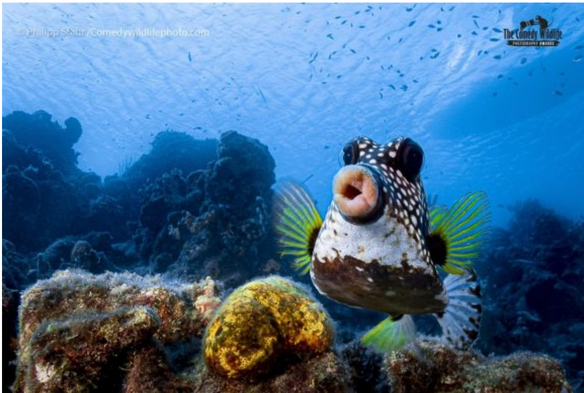
Comedy Wildlife Photography Awards 2021.

https://www.radiohc.cu/index.php/de-interes/miscelanea/261280-animales-con-sentido-del-humor-las-fotos-mas-graciosas-del-2021