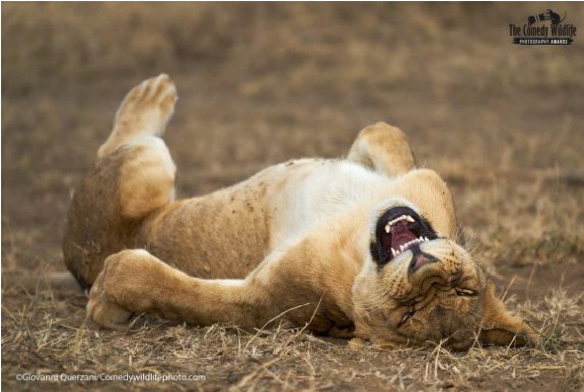
Comedy Wildlife Photography Awards 2021

“Un cachorro de león en el Parque Nacional del Serengeti, Tanzania, aparentemente se ríe de mis habilidades fotográficas”.