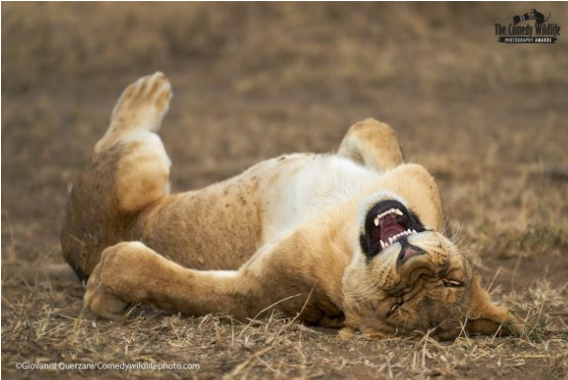
Comedy Wildlife Photography Awards 2021

“Un cachorro de león en el Parque Nacional del Serengeti, Tanzania, aparentemente se ríe de mis habilidades fotográficas”.