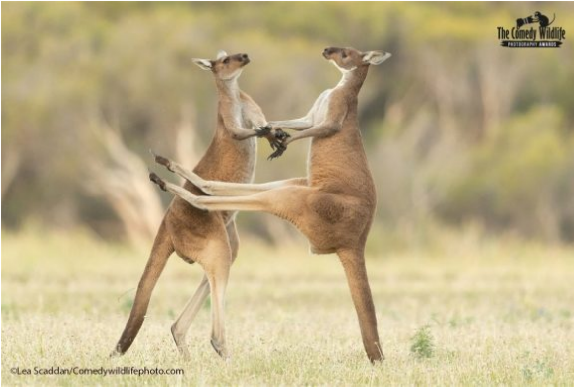
Comedy Wildlife Photography Awards 2021.