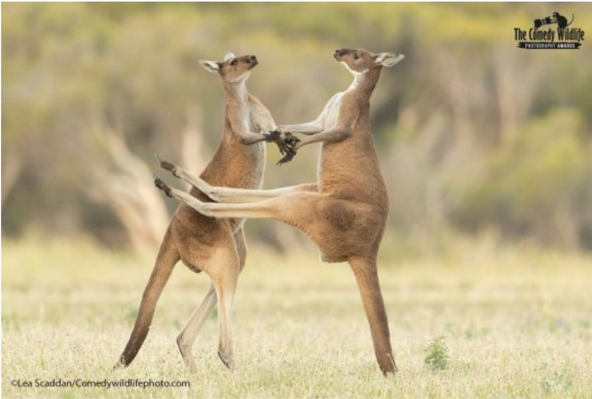
Comedy Wildlife Photography Awards 2021.