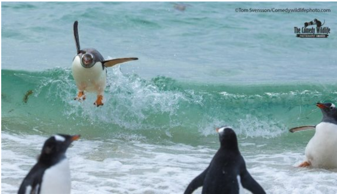
Comedy Wildlife Photography Awards 2021.

“Estos pingüinos estaban surfeando sobre las olas y se veían tan felices...”