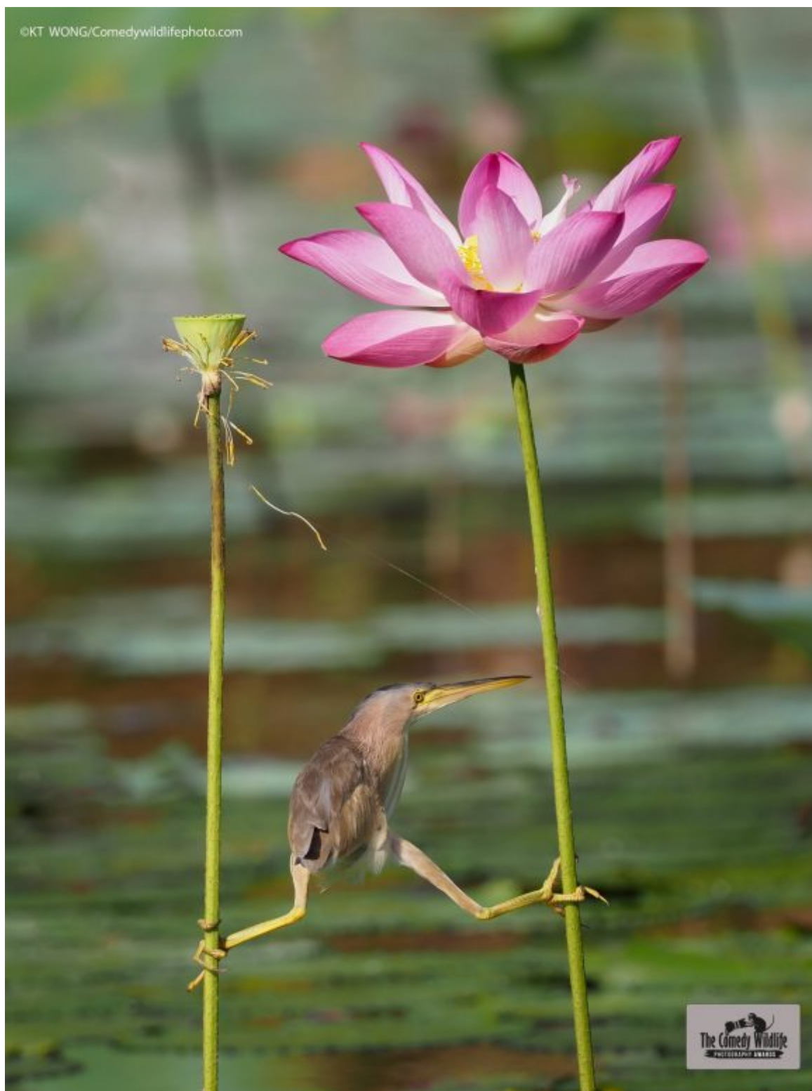
Comedy Wildlife Photography Awards 2021.