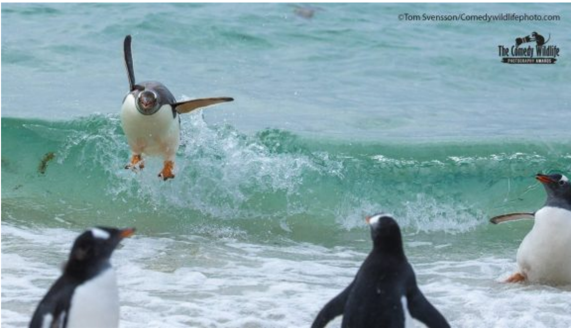
Comedy Wildlife Photography Awards 2021.

“Estos pingüinos estaban surfeando sobre las olas y se veían tan felices...”