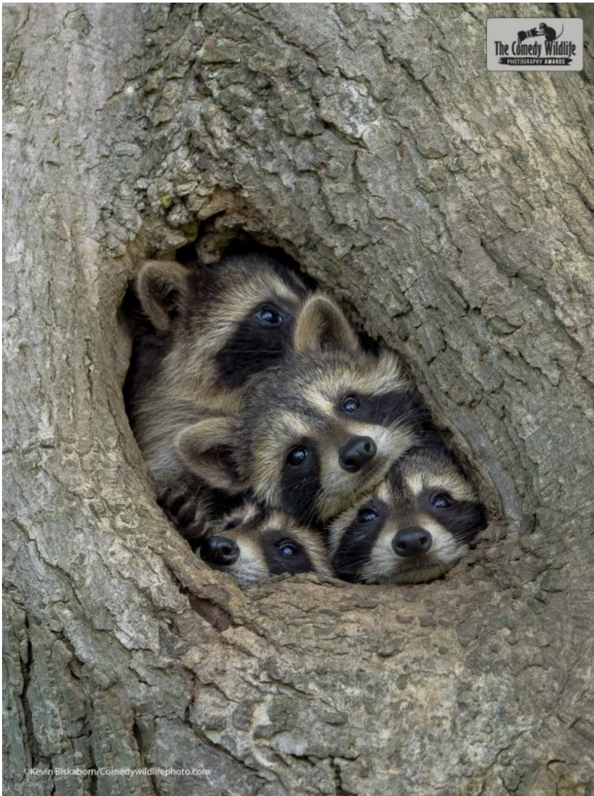
Comedy Wildlife Photography Awards 2021