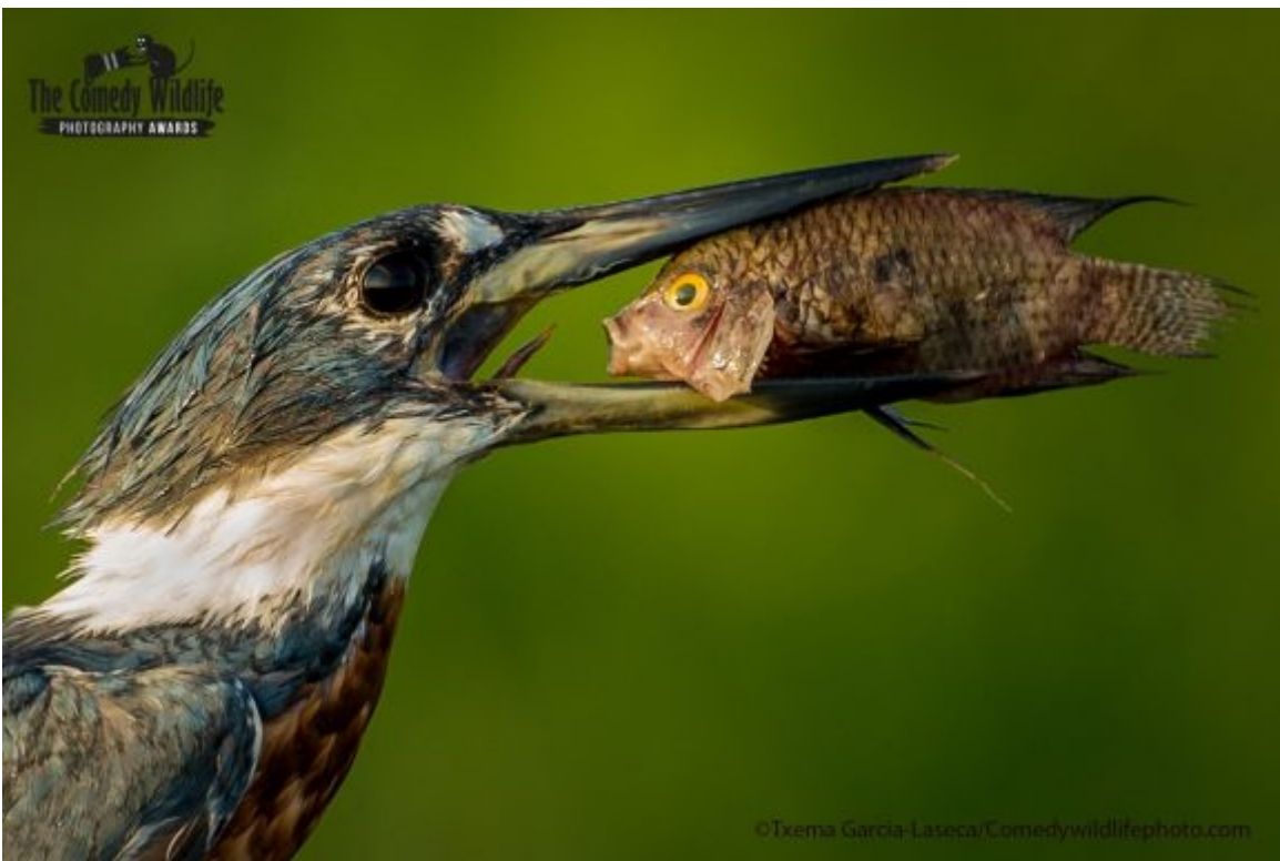
Foto: Txema García Laseca. Comedy Wildlife Photography Awards 2021.

“Este pez se sorprende de su mala fortuna tras haber sido atrapado por un pájaro pescador”.