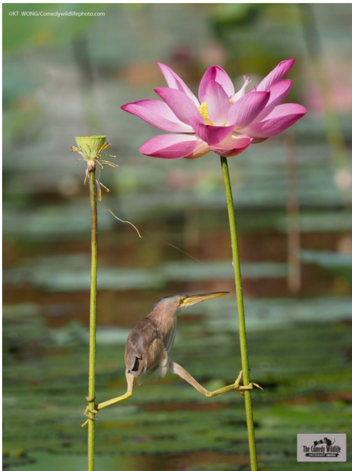
Comedy Wildlife Photography Awards 2021.