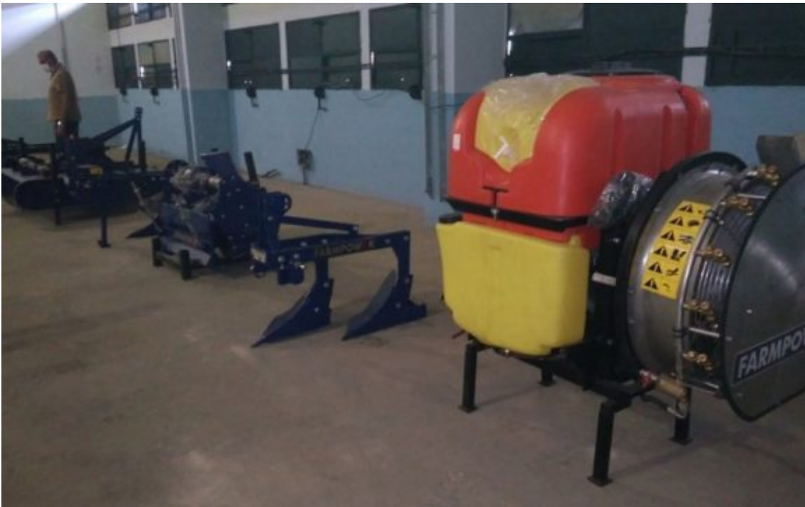
Tractores eléctricos para su validación en la agricultura cubana.