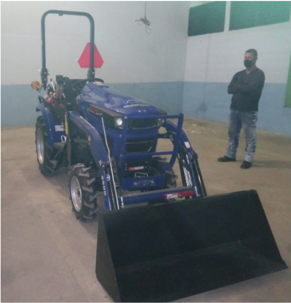
Tractores eléctricos para su validación en la agricultura cubana.