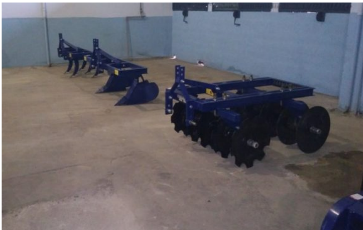
Tractores eléctricos para su validación en la agricultura cubana.

Con esto también el Ministerio de la Agricultura implementa la política, ratificada con las medidas aprobadas por el Buró Político del Partido Comunista de Cuba, para dinamizar la producción agropecuaria.