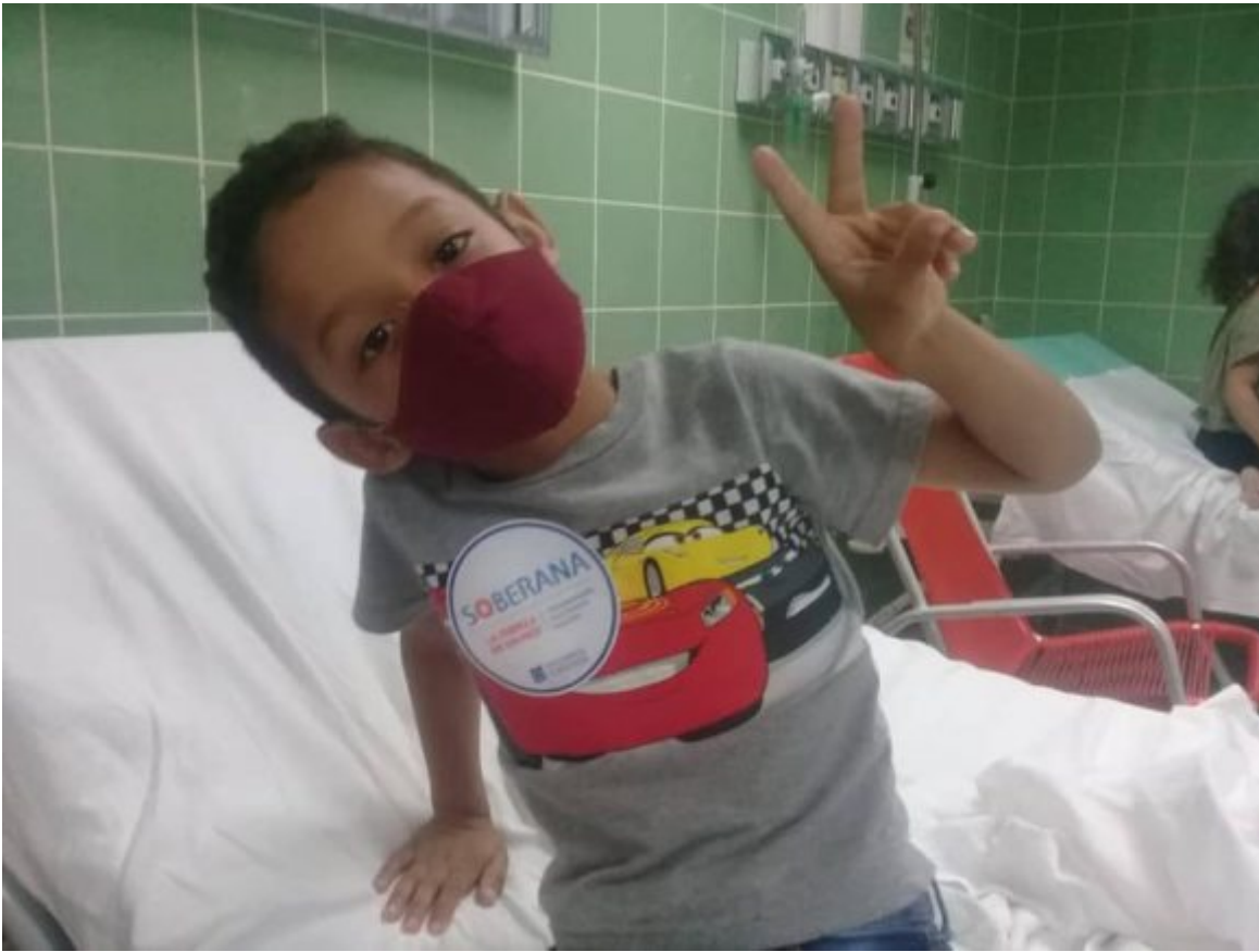
Ensayo Pediátrico Fase I niños de 3 a 11 años.