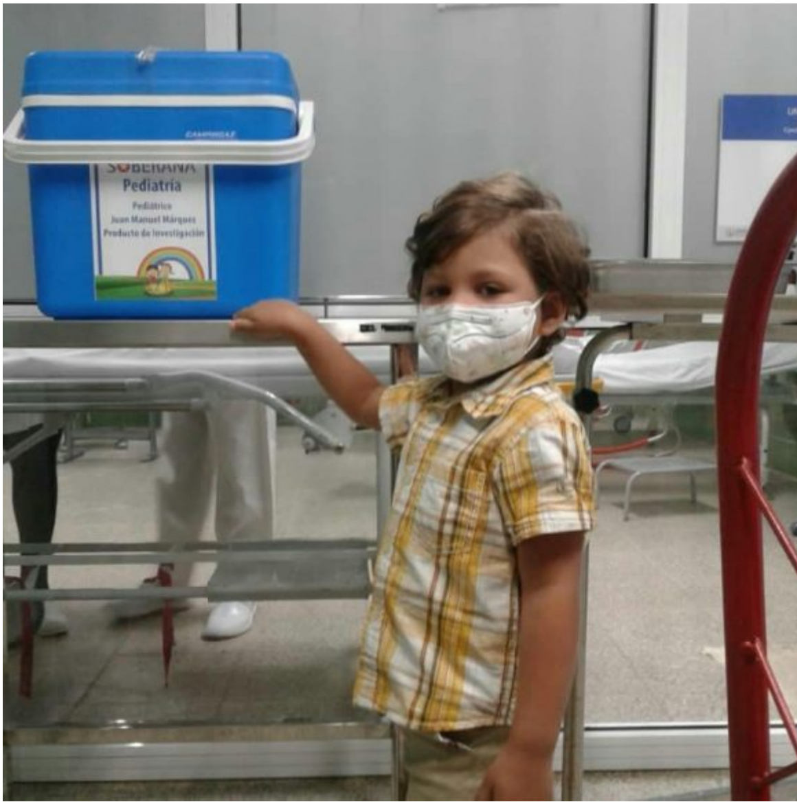
Ensayo Pediátrico Fase I niños de 3 a 11 años.