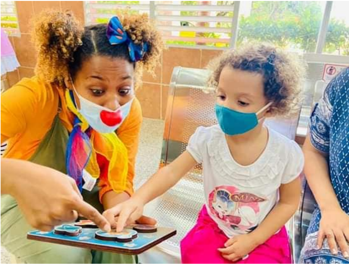
Ensayo Pediátrico Fase I niños de 3 a 11 años.