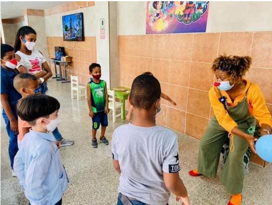
Ensayo Pediátrico Fase I niños de 3 a 11 años.