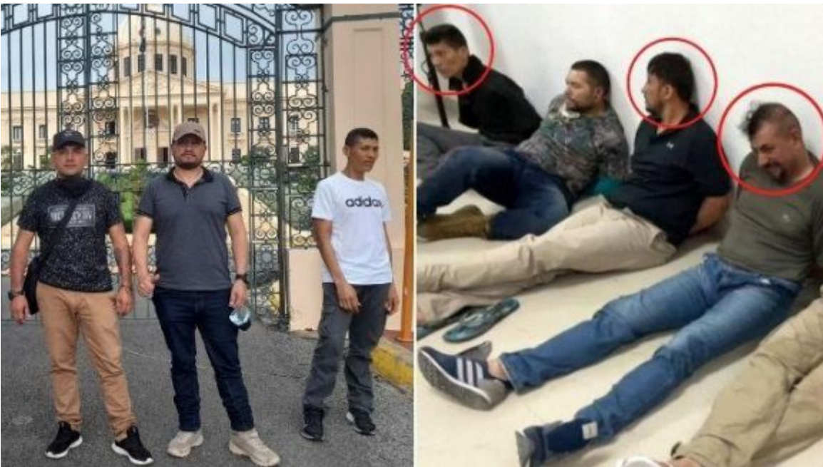
En esta imagen se puede apreciar a tres de los capturados.