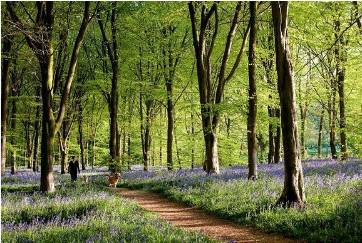
El bullicio de las calles londinenses parece un sueño lejano cuando uno se sienta bajo la cúpula dorada de Savernake Forest, en el condado de Wiltshire y cerca de la ciudad de Marlborough.