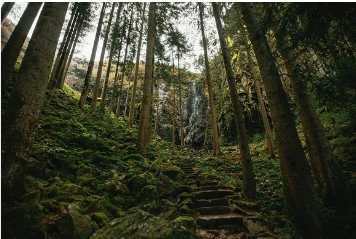
Cerca de 6 000 kilómetros cuadrados de abetales se extienden entre las ciudades de Friburgo y Basilea, en el estado de Baden-Wurtemberg.