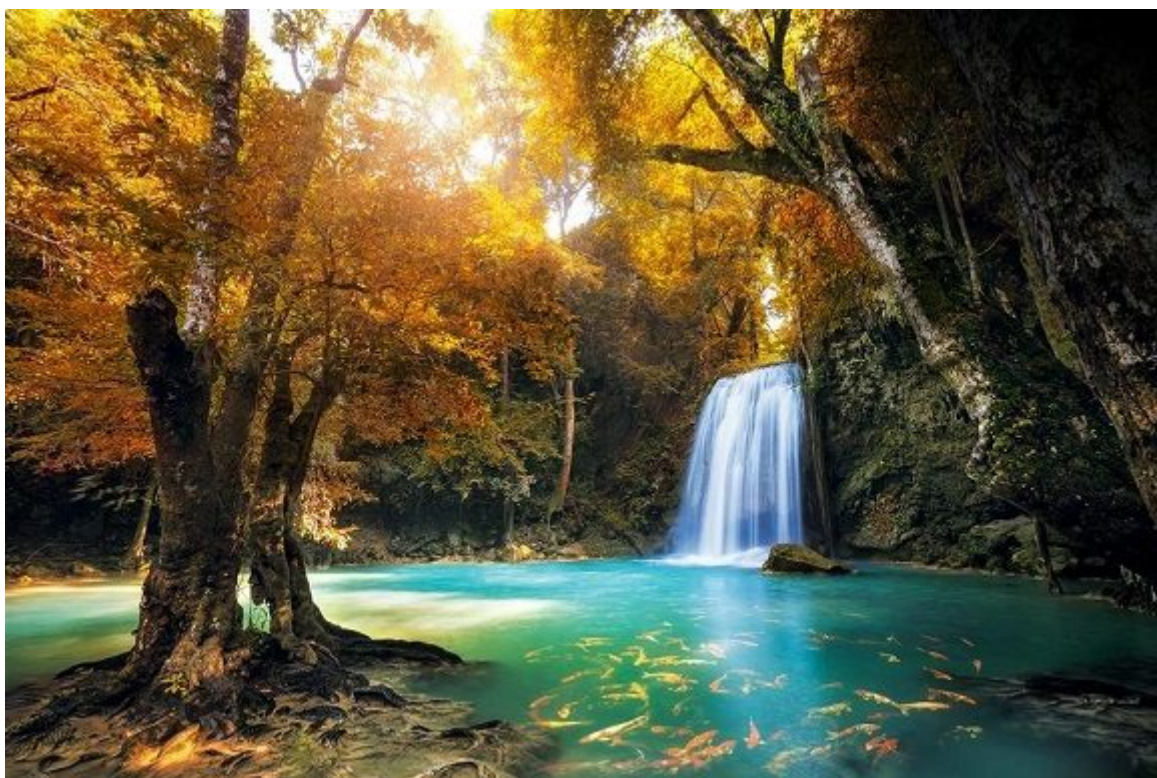
Ardillas voladoras, monos y numerosas aves habitan este idílico rincón de Tailandia.

En esta lista les dejamos algunos de los 10 bosques más impresionantes del mundo: desde España hasta Nueva Zelanda pasando por Canadá, la Patagonia argentina, California, Inglaterra, Croacia, la Selva Negra, Chile o Japón.