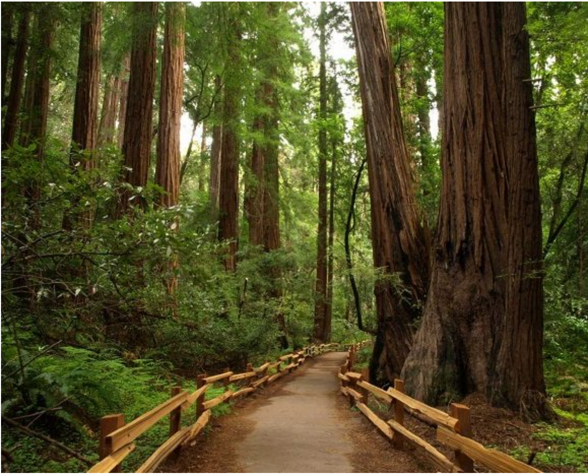
En el área de Kings Canyon y dentro del bosque Grant Grove vive otra secuoya gigante: el General Grant, de 81 metros de alto.