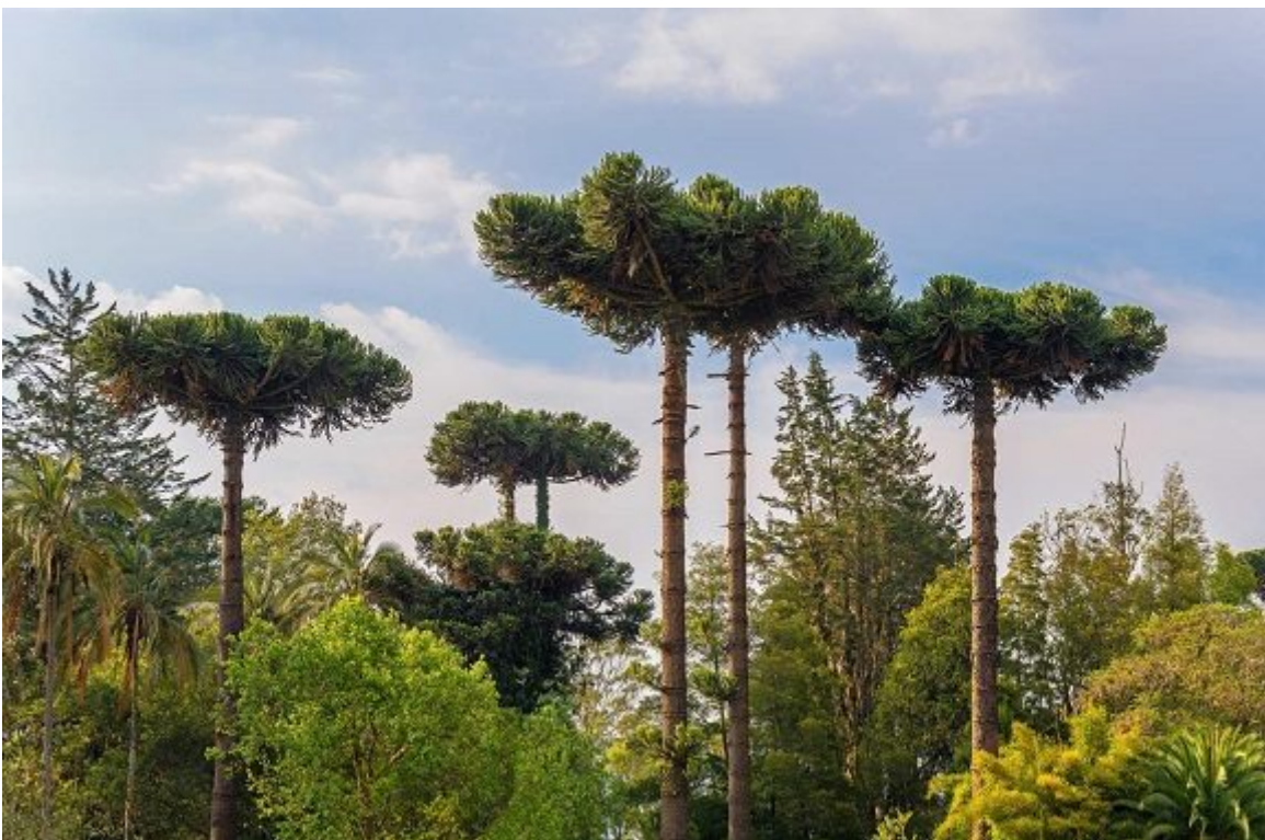
La araucaria, la conífera que da nombre a toda una región en Chile, caracteriza el paisaje del Parque Nacional de Conguillío, emplazado 800 kilómetros al sur de Santiago.