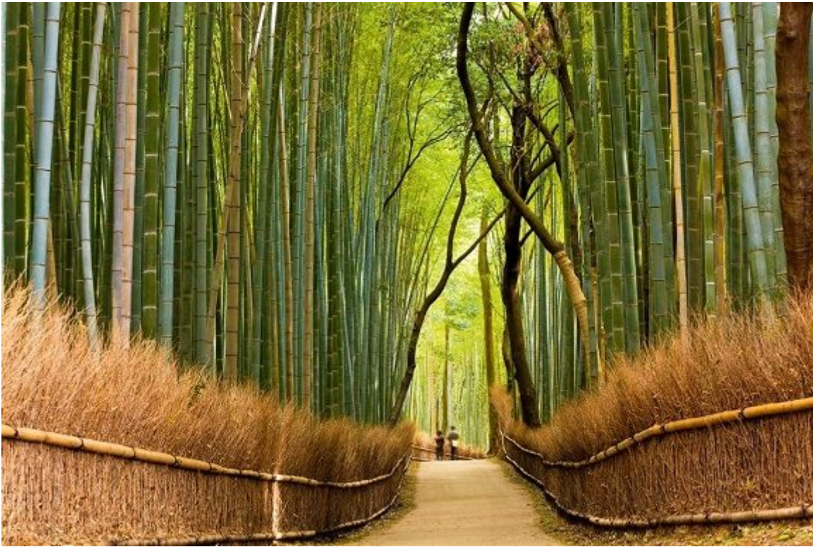
Apenas media hora de tren separa la preciosa ciudad de Kioto del magnífico bosque de bambú de Sagano, en el distrito de Arashiyama.