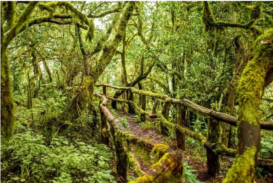
El centro de La Gomera es un inmenso manto verde envuelto a menudo por una espesa niebla.