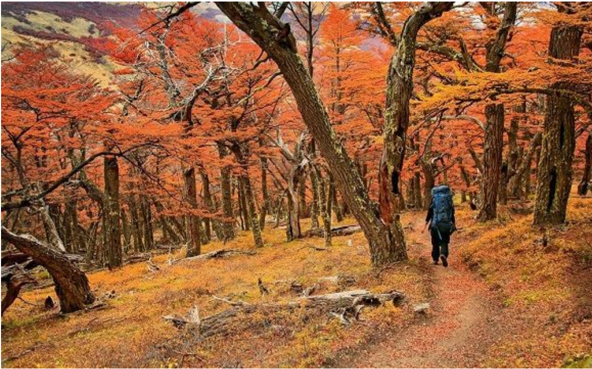
El impresionante glaciar Perito Moreno es la estrella del Parque Nacional de los Glaciares, en la provincia argentina de Santa Cruz.