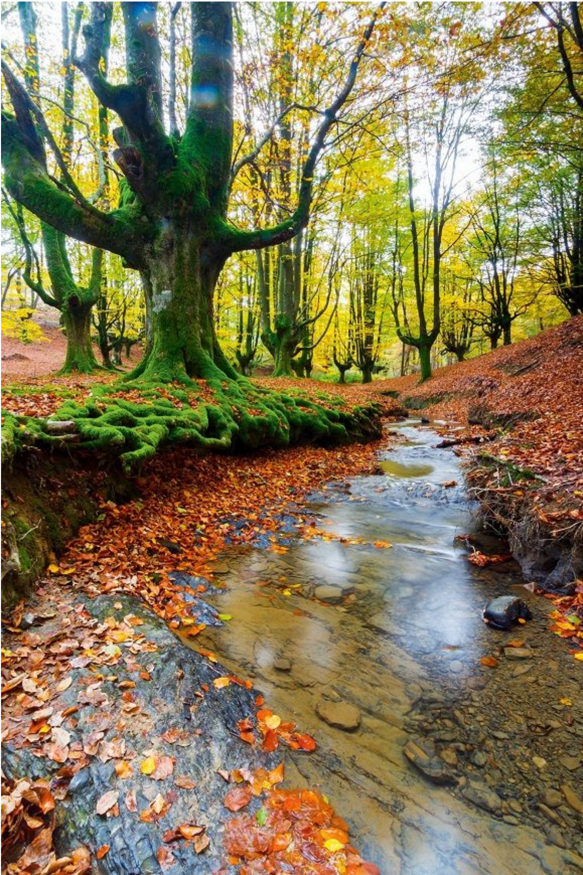
Límite de provincias y símbolo del excursionismo y la cultura vasca, el Parque Natural de Gorbeia es un lugar imprescindible.