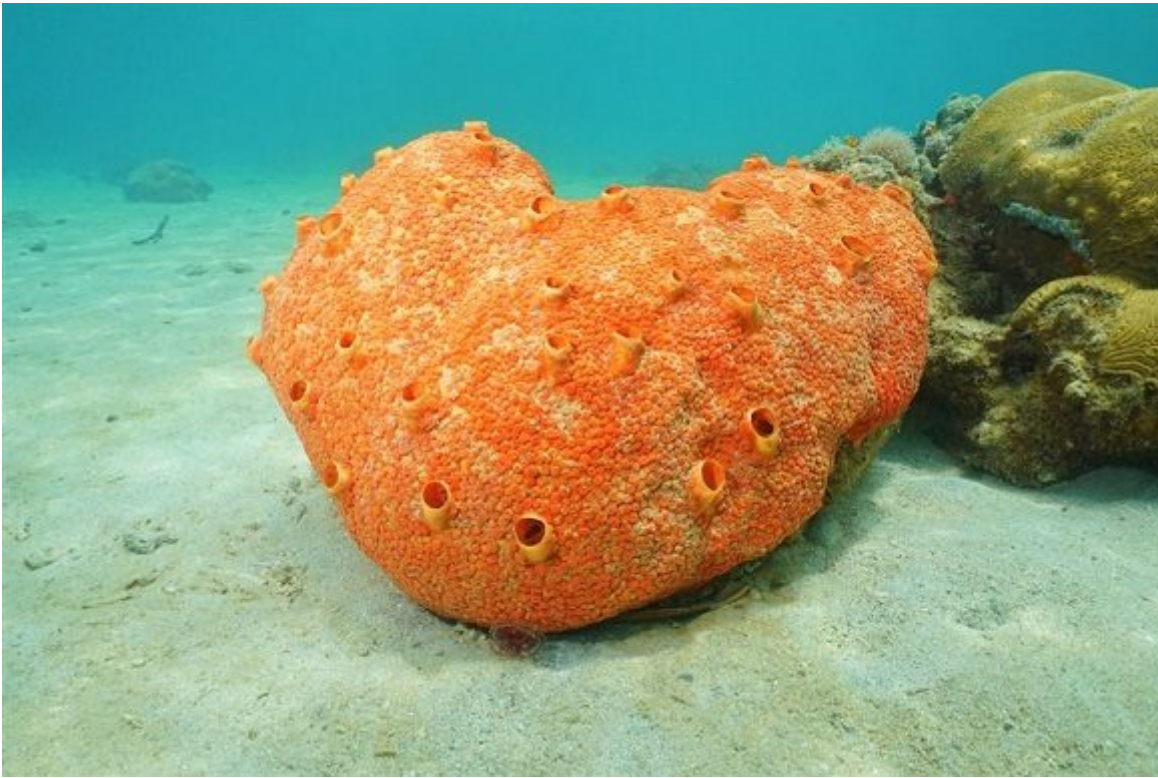
Cliona delitrix. Esponja de la clase demospongiae, o esponja córnea.

https://www.radiohc.cu/index.php/de-interes/miscelanea/265400-descubren-nuevo-candidato-al-anim-fossil-mas-antiguo-de-la-historia