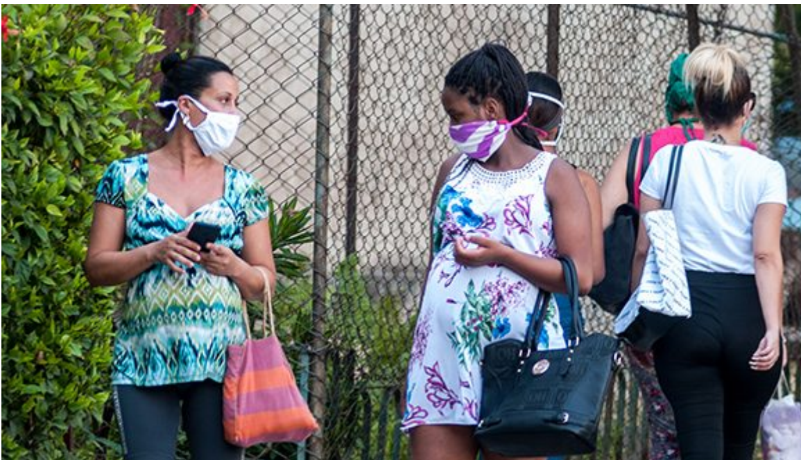
Embarazadas en tiempo de pandemia.

Enfatizó en la necesidad de estar alertas ante el más mínimo síntoma. “Todos deben estar conscientes de que se trata de una enfermedad que puede tener una rápida progresión hacia la gravedad y, por tanto, es vital acudir con inmediatez a los servicios médicos”.