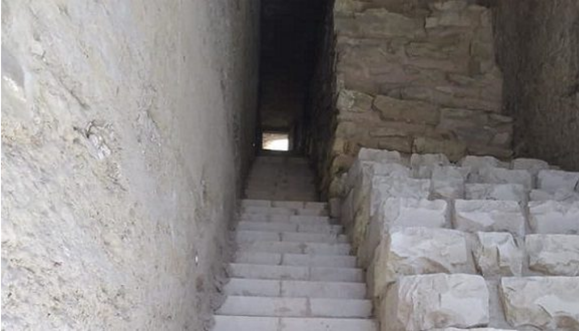
La Tumba Sur del rey Zoser.

La restauración incluyó estudios de ingeniería geotécnica, geociencia y arqueología.