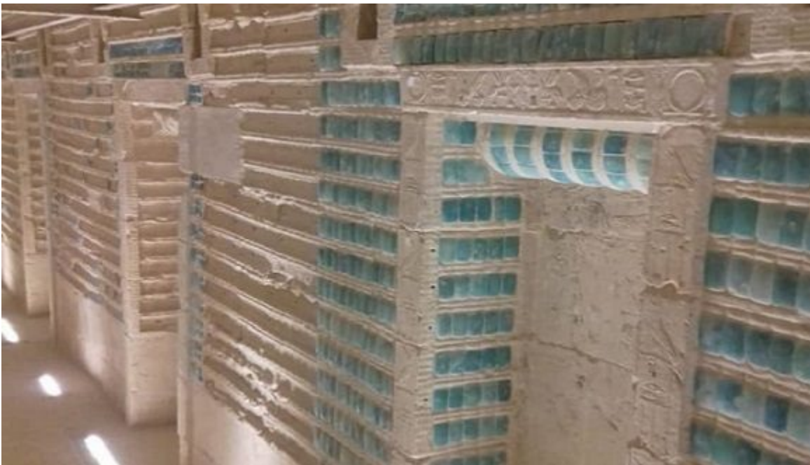
Foto: El interior de la Tumba Sur del rey Zoser. Facebook/ Ministry of Tourism and Antiquities ?????? ???????