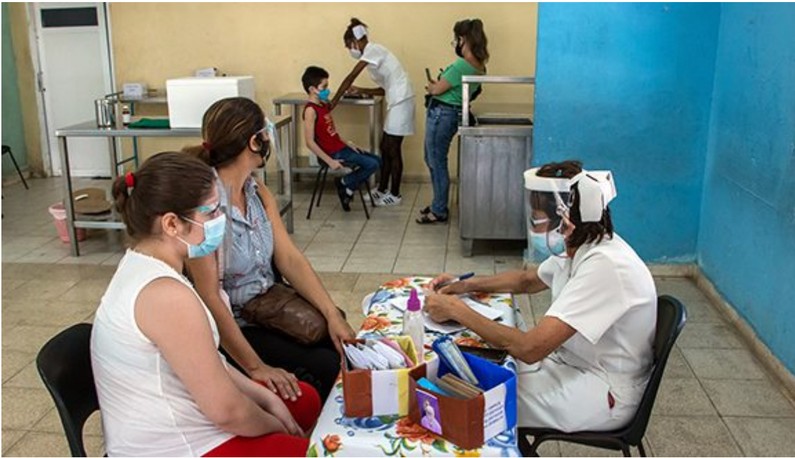
Comienza vacunación a niños del reparto Antonio Maceo en La Habana.

https://www.radiohc.cu/index.php/especiales/exclusivas/270515-ninos-de-dos-a-11-anos-reciben-primera-dosis-de-soberana-02-en-cuba-fotos