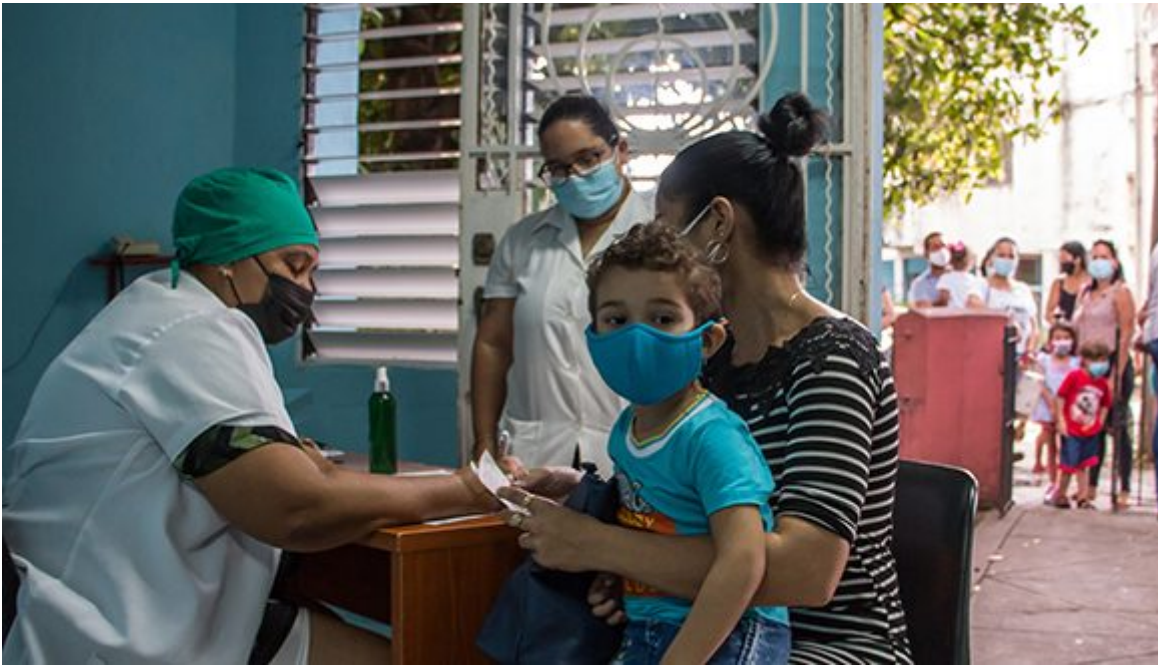
Vacunación a niños de dos a 11 años en La Habana.