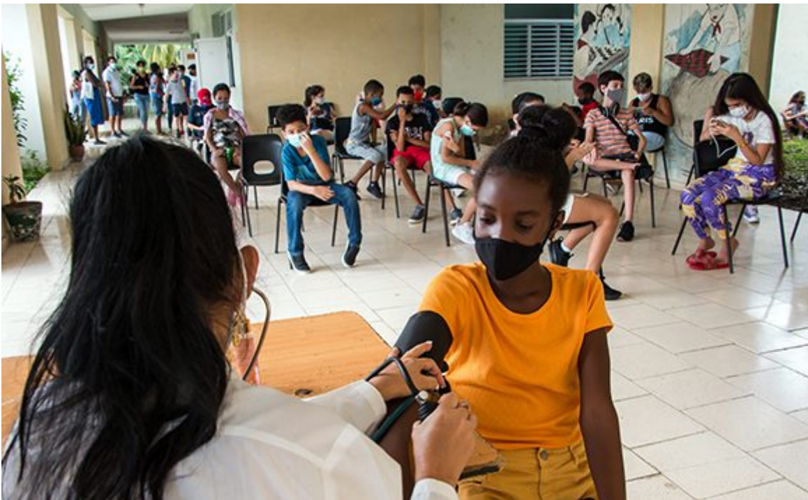
Área de observación en la escuela primaria "Poland Saborit", del Cerro, La Habana.