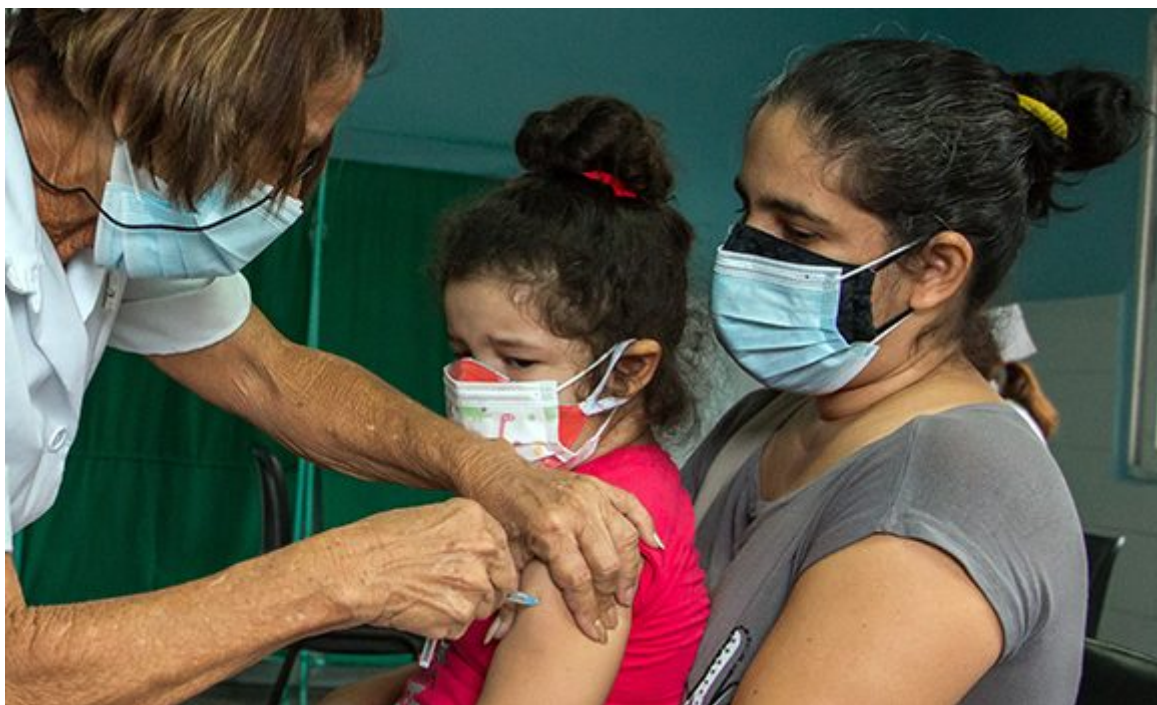
Comienza vacunación a niños de dos a 11 años del reparto Antonio Maceo en La Habana.