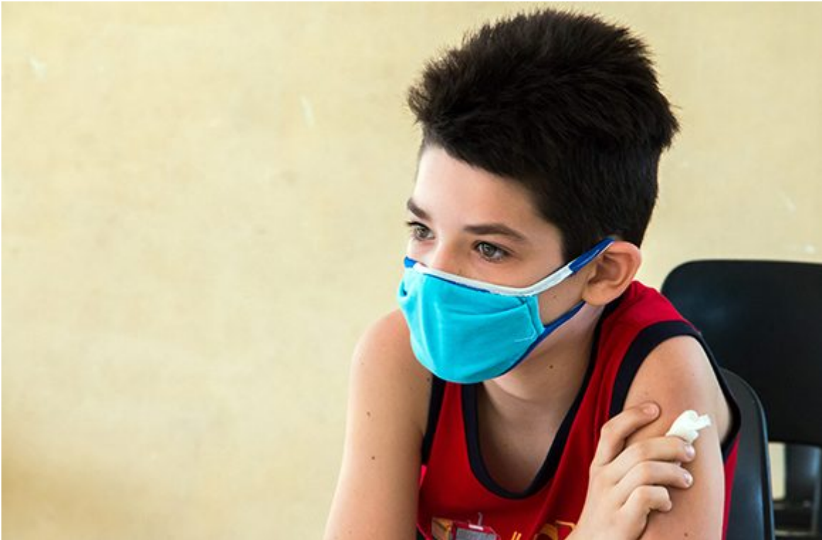
Vacunación a niños del reparto Antonio Maceo en La Habana.