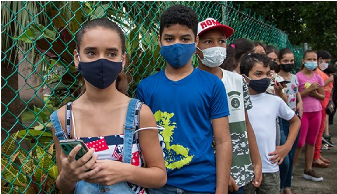
Niños esperan su turno para ser vacunados contra la COVID-19.