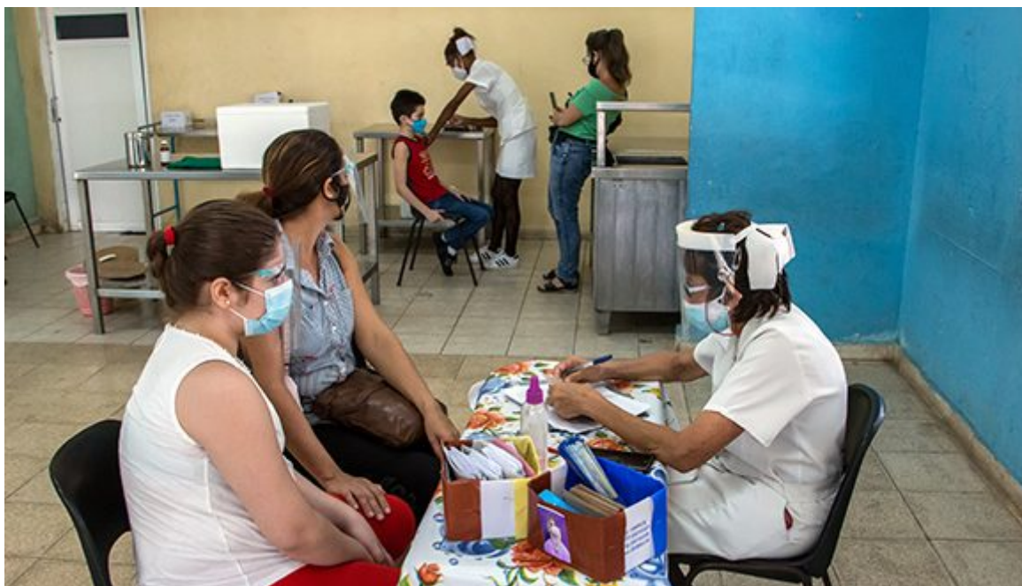
Comienza vacunación a niños del reparto Antonio Maceo en La Habana.

https://www.radiohc.cu/index.php/especiales/exclusivas/270515-ninos-de-dos-a-11-anos-reciben-primera-dosis-de-soberana-02-en-cuba-fotos