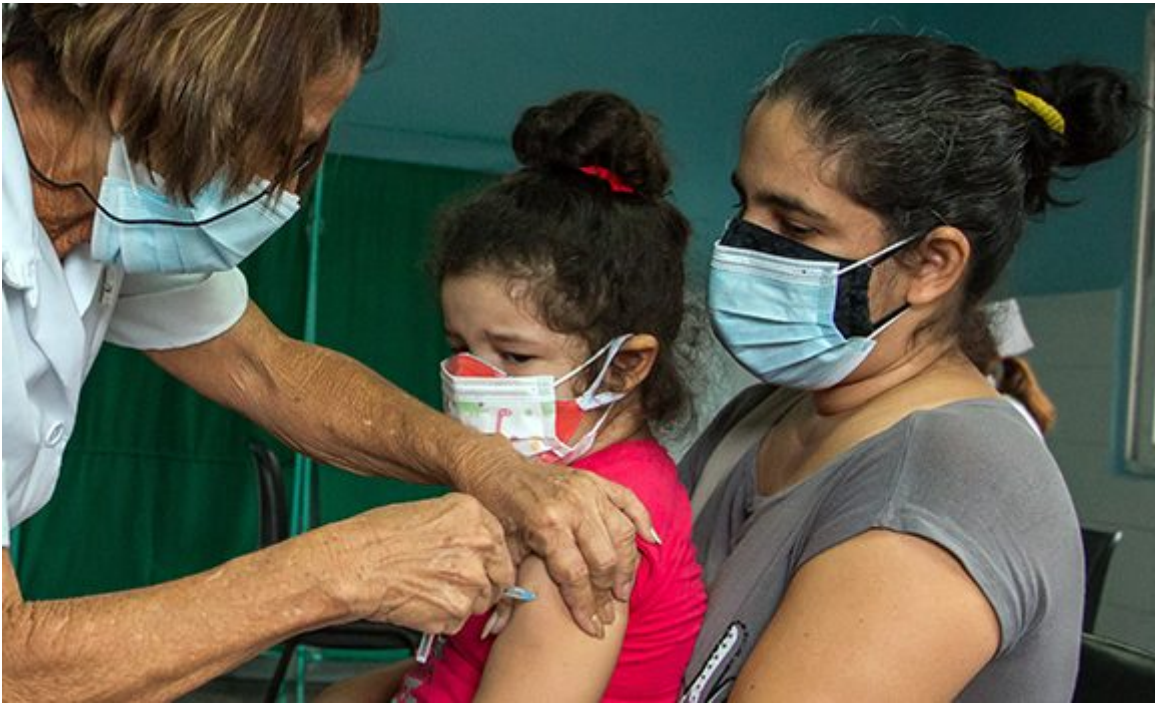
Comienza vacunación a niños de dos a 11 años del reparto Antonio Maceo en La Habana.