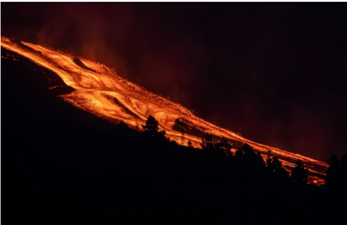
La lava avanza por su 'autopista' en la noche del martes.