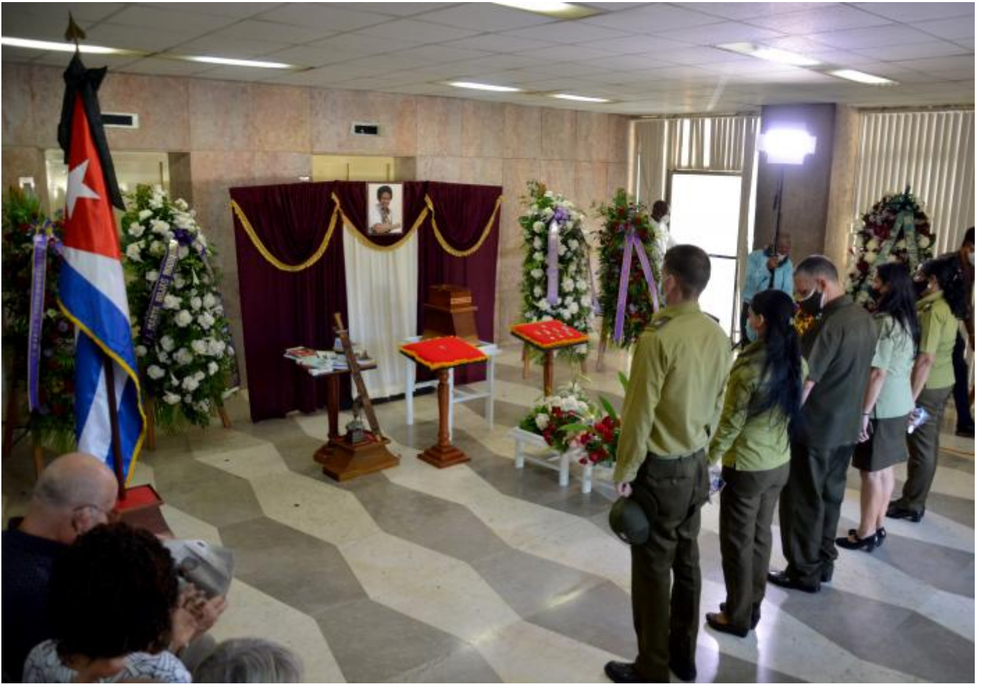
Una representación de las Fuerzas Armadas Revolucionarias, del Ministerio del Interior, del Sindicato Nacional de los Trabajadores de la Cultura y de la Unión de Periodistas de Cuba visitó, igualmente, el rotativo ubicado en el municipio habanero de Plaza de la Revolución, para rendirle homenaje póstumo a la periodista del Moncada.