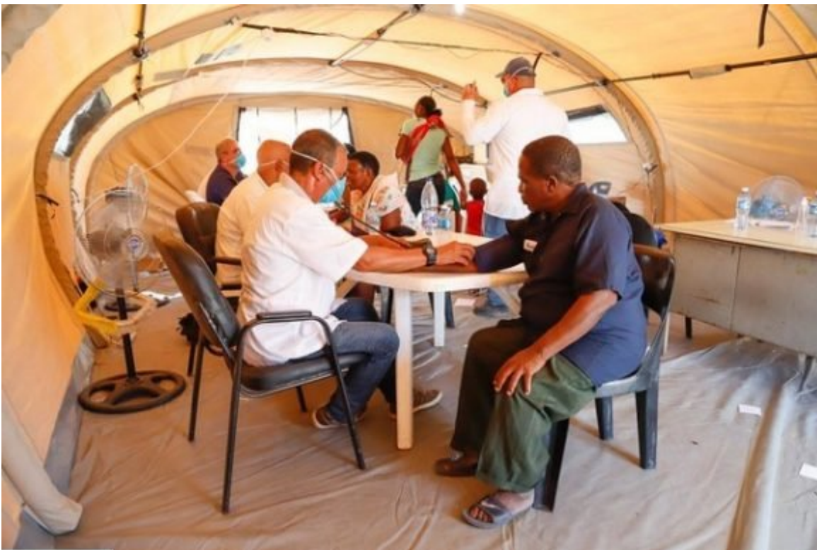
Integrantes del Contingente cubano de la salud Henry Reeve atienden al pueblo mozambicano, duramente golpeado por el pasado de un huracán, abril de 2019.

Cuba fue uno de los primeros países del mundo en dar respuesta al llamado de la Organización Mundial de la Salud -OMS-, y la Organización de Naciones Unidas para enfrentar la epidemia de Ébola en África en 2014 y en 2010 asistieron a los damnificados por el devastador sismo en Haití.