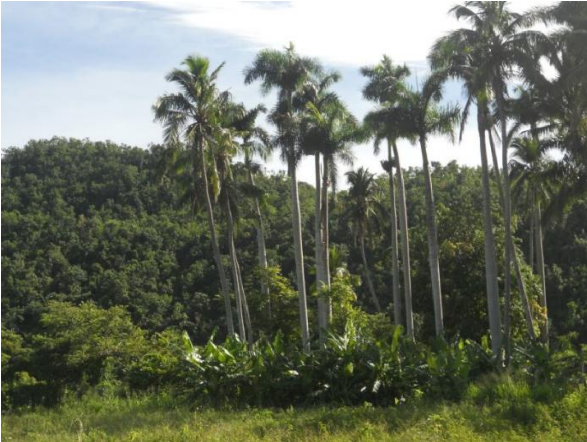
Lomas de Tasajera

Dispone, además, entre las prohibiciones principales el uso del fuego dentro de los límites del área protegida, así como extraer especies de la flora, fauna, arqueológico o espeleológico, ni muestras de otro tipo sin autorización oficial.