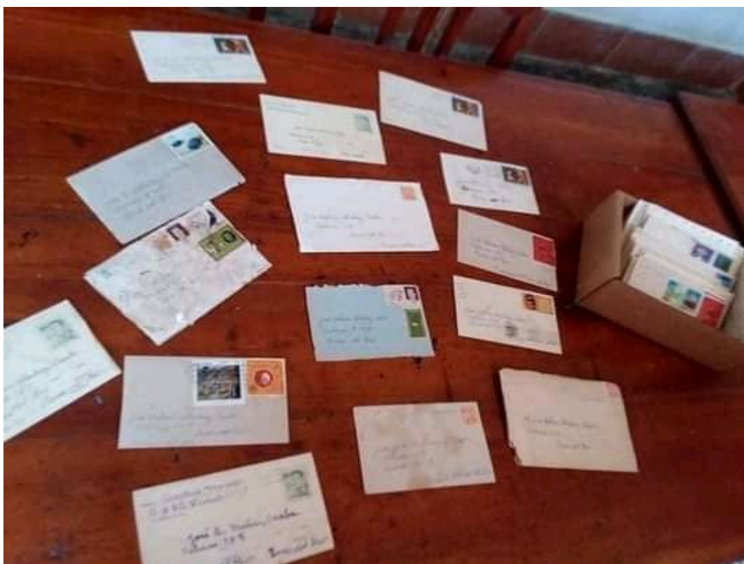
Las cartas pasarán a formar parte del patrimonio del Centro de Promoción y Desarrollo de la Literatura.

https://www.radiohc.cu/index.php/noticias/cultura/275997-en-edicion-libro-con-50-cartas-ineditas-de-poetisa-cubana-dulce-maria-loynaz