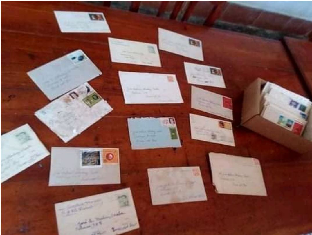
Las cartas pasarán a formar parte del patrimonio del Centro de Promoción y Desarrollo de la Literatura.

https://www.radiohc.cu/index.php/noticias/cultura/275997-en-edicion-libro-con-50-cartas-ineditas-de-poetisa-cubana-dulce-maria-loynaz