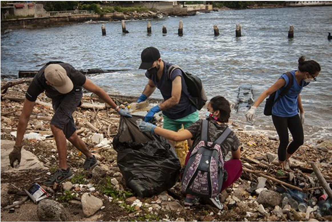
Red Verde.