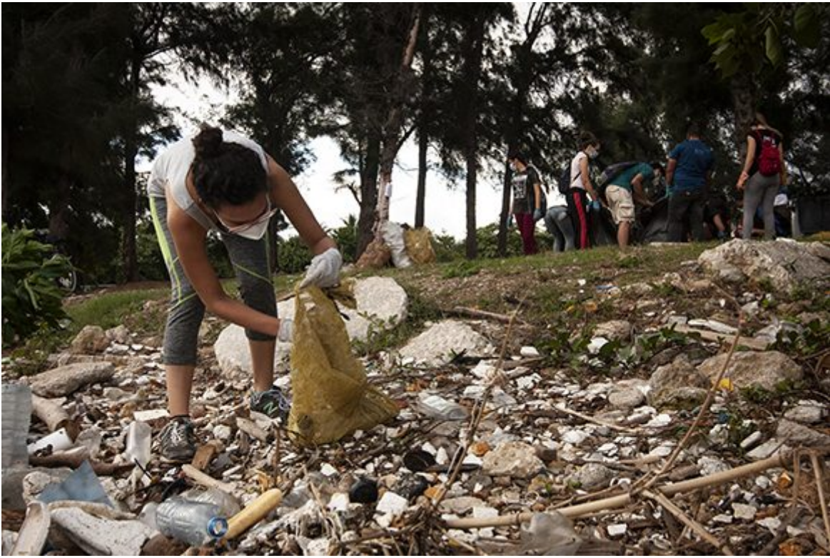
Red Verde.