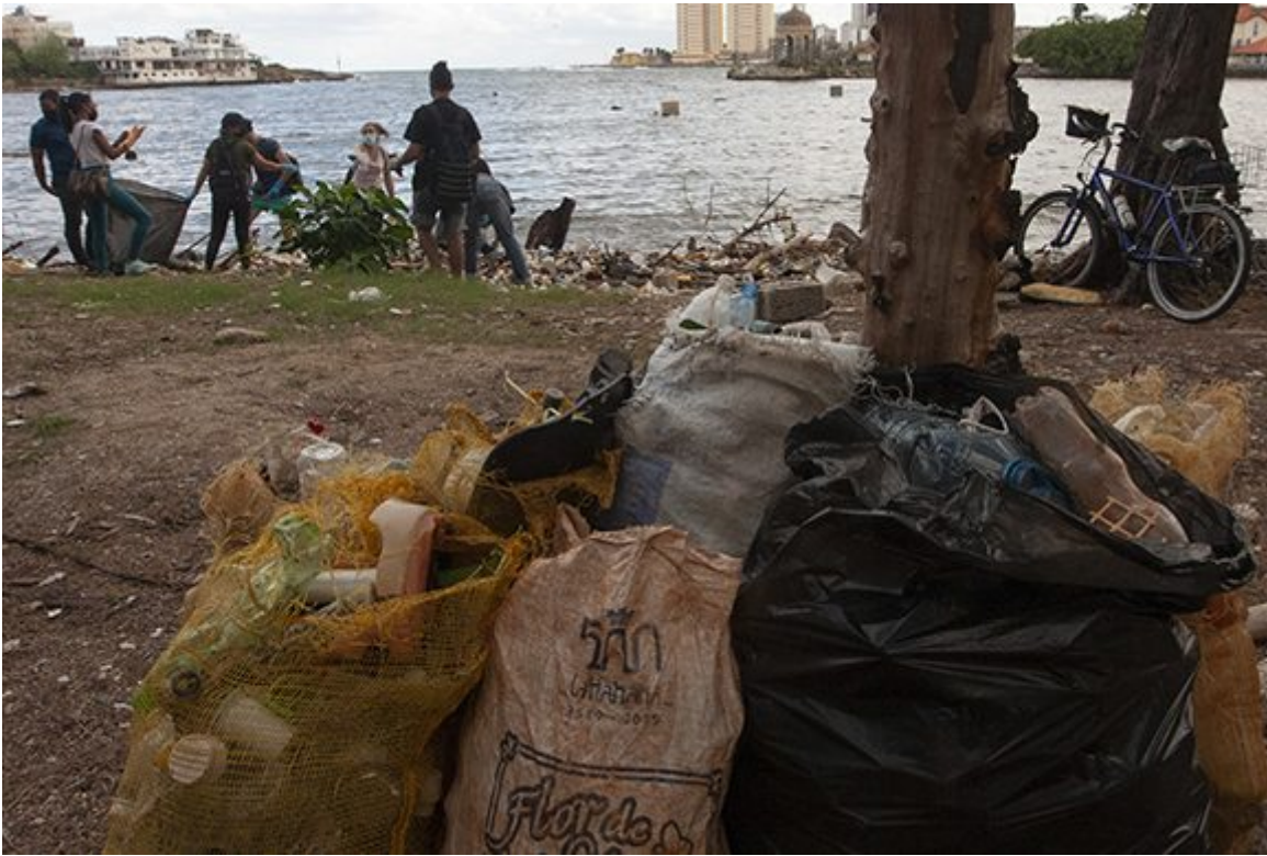
Red Verde.