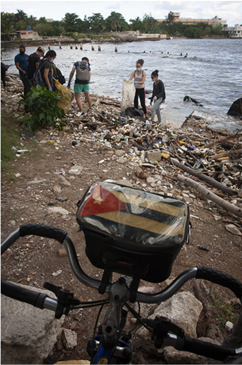
Red Verde.