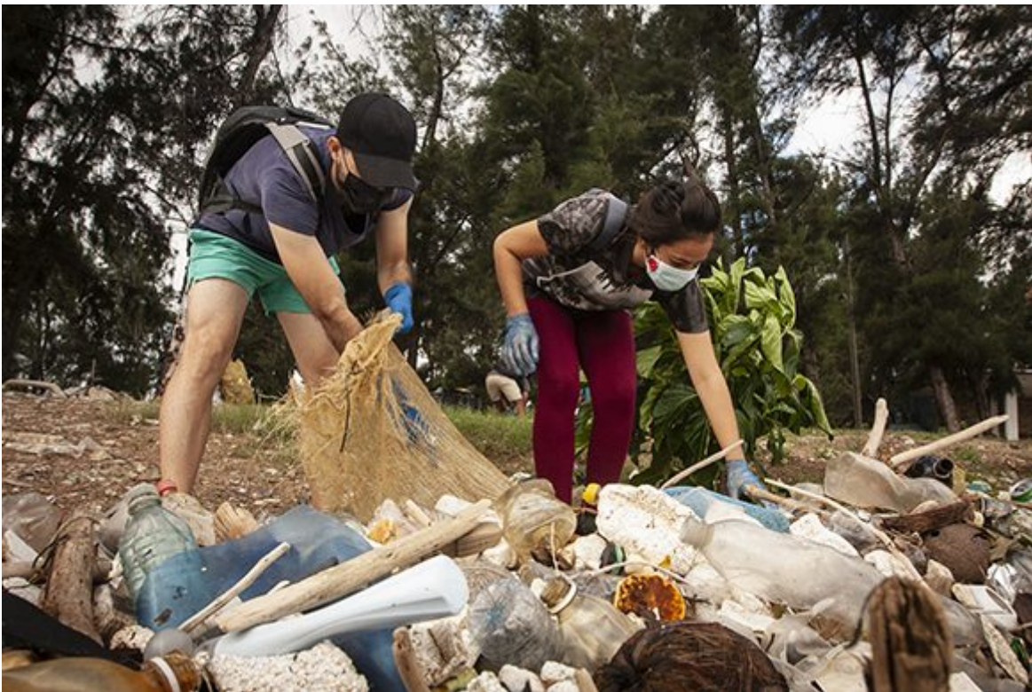
Red Verde.