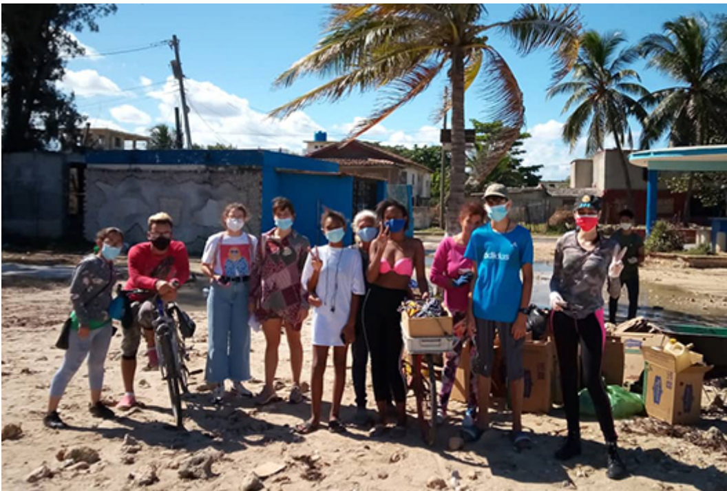
En la playa de Santa Fe.