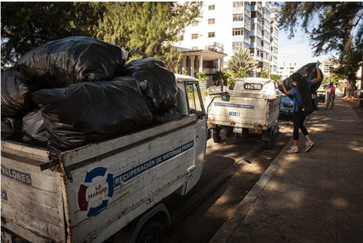
Red Verde.