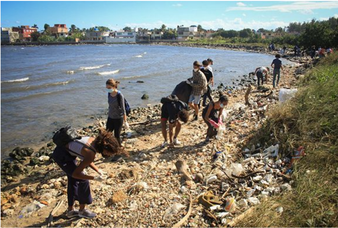
La desembocadura del Quibú, acaso la mas critica.

https://www.radiohc.cu/index.php/noticias/ciencias/276491-cuba-una-red-de-voluntades-fotos