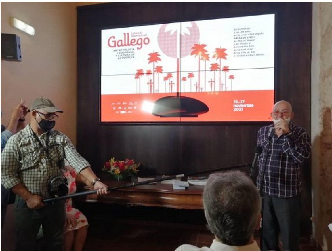
Presentan programa de actividades para celebrar el aniversario 502 de la fundación de la ciudad.

"Ese día, luego de que nuestro historiador adjunto anuncie el nuevo aniversario 502, estaremos enviando un mensaje de paz y amor a todos los cubanos donde quiera que se encuentren a esa hora", concluyó.