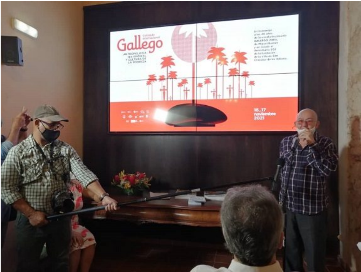
Presentan programa de actividades para celebrar el aniversario 502 de la fundación de la ciudad.

"Ese día, luego de que nuestro historiador adjunto anuncie el nuevo aniversario 502, estaremos enviando un mensaje de paz y amor a todos los cubanos donde quiera que se encuentren a esa hora", concluyó.