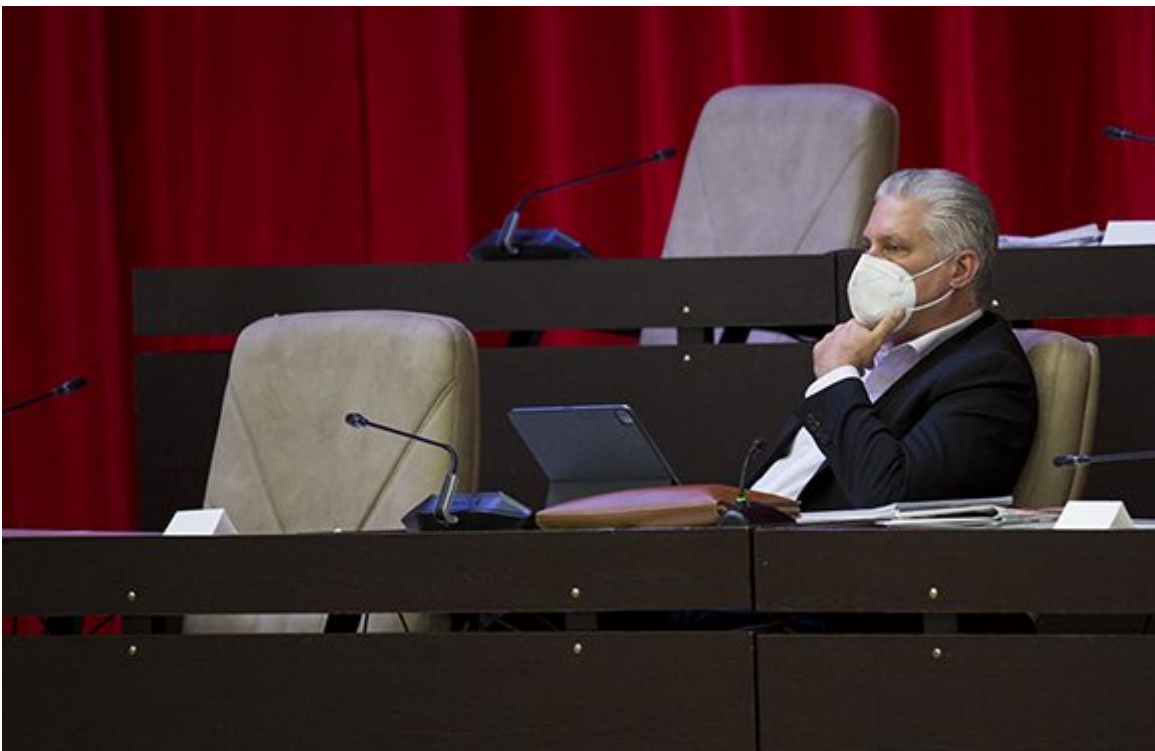
Con la presencia del presidente Miguel Díaz-Canel Bermúdez, los legisladores se reúnen en el Palacio de La Habana.