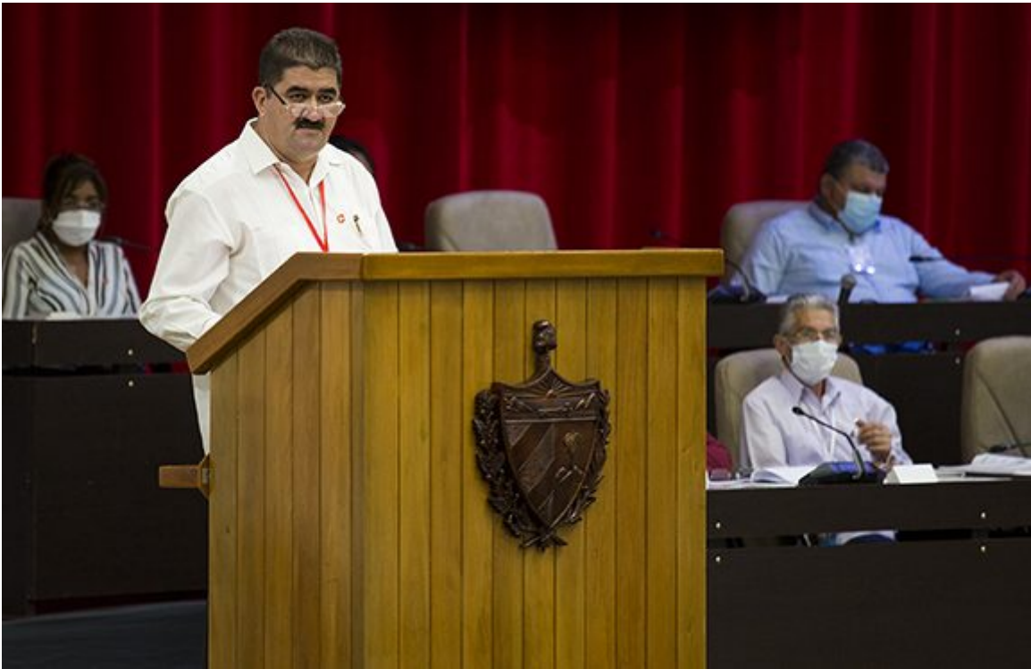
Manuel Sobrino Martínez, ministro de la Industria Alimentaria.

Al intervenir ante la Asamblea, el ministro de la Industria Alimentaria, Manuel Sobrino Martínez, señaló que además de la compleja situación económica del país, existen una deficiente gestión empresarial, mala contratación, impagos a productores y otros problemas subjetivos.