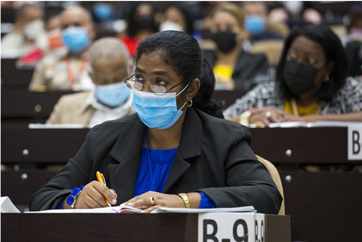
Los legisladores se reúnen en el Palacio de La Habana, como parte de las actividades previas al Octavo Período Ordinario de Sesiones de la Asamblea Nacional del Poder Popular en su novena legislatura.