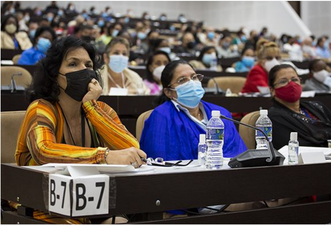
Diputados durante las actividades previas al Octavo Periodo Ordinario de Sesiones de la Asamblea Nacional del Poder Popular en su novena legislatura.

https://www.radiohc.cu/index.php/especiales/exclusivas/280443-como-marchan-las-63-medidas-para-dinamizar-la-agricultura