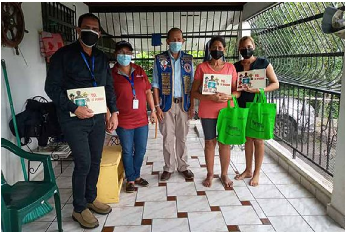
Panameños son alfabetizados con el método cubano Yo sí puedo.

Entre 2002 y 2021, más de 10 millones de personas en 130 países aprendieron a leer y a escribir con el método Yo sí puedo, el cual permitió a varias naciones del continente como Venezuela y Bolivia recibir el certificado de libres de analfabetismo por la Organización de las Naciones Unidas para la Educación, la Ciencia y la Cultura (Unesco).