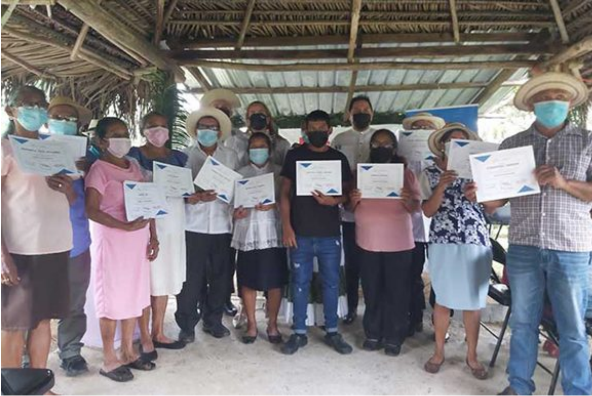
Panameños son alfabetizados con el método cubano Yo sí puedo.

Satisface constatar los resultados que atesora hasta la fecha el programa local Muévete por Panamá, remarcó.