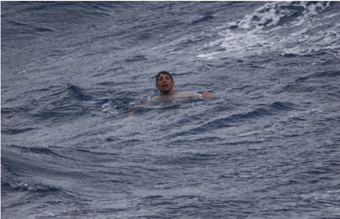
Nafragio de cubanos al sur de Estados Unidos en 2021.