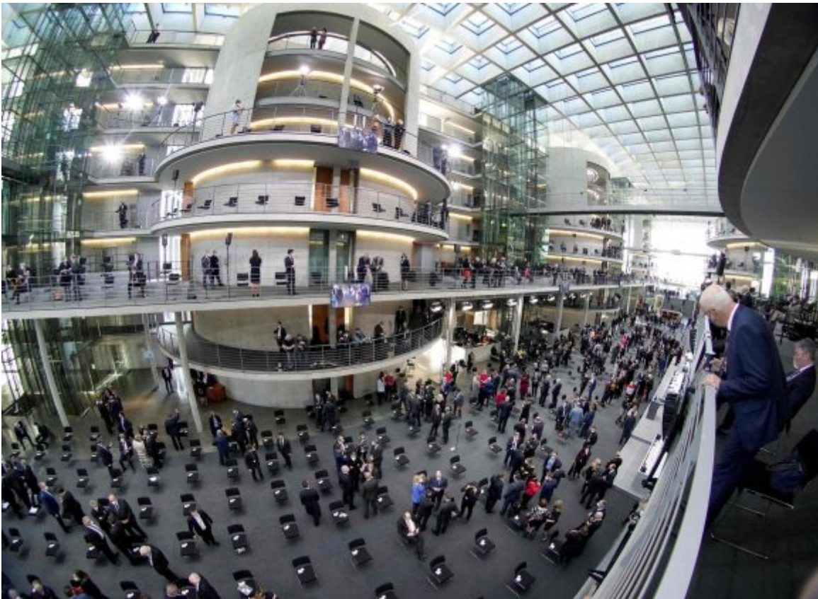
Los participantes en la asamblea federal a su llegada al edificio Paul-Löbe-Haus del Parlamento.

El segundo mandato de Steinmeier comienza el 18 de marzo.