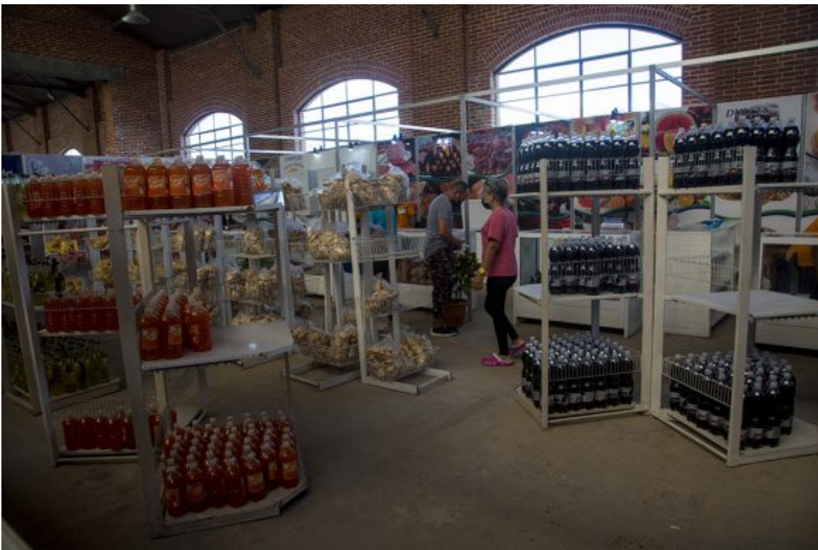
Feria de Linea y 18.