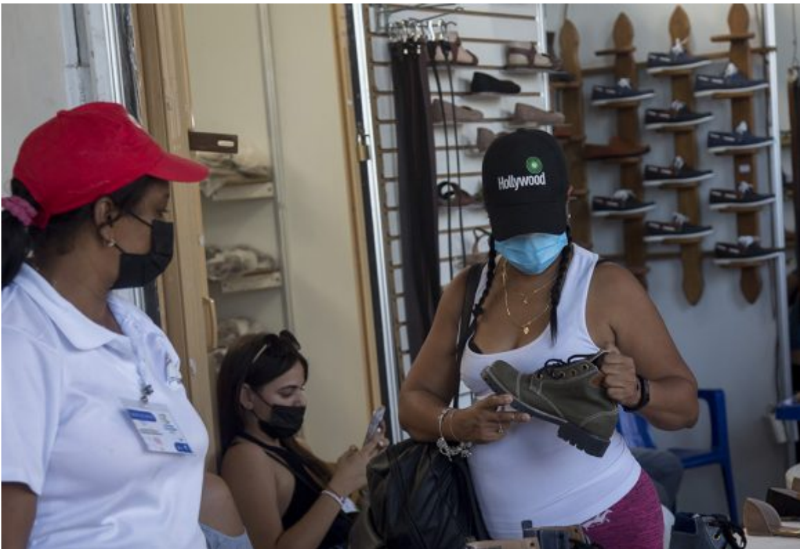
Feria de Linea y 18.