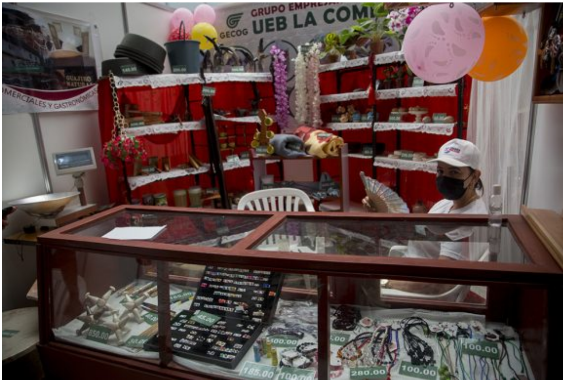
Feria de Linea y 18.