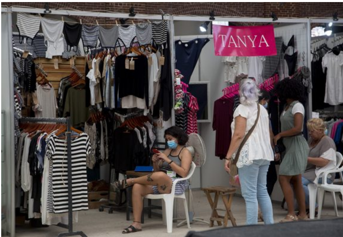
Feria de Linea y 18.