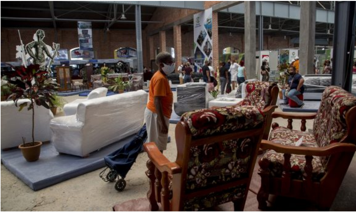
Feria de Linea y 18.