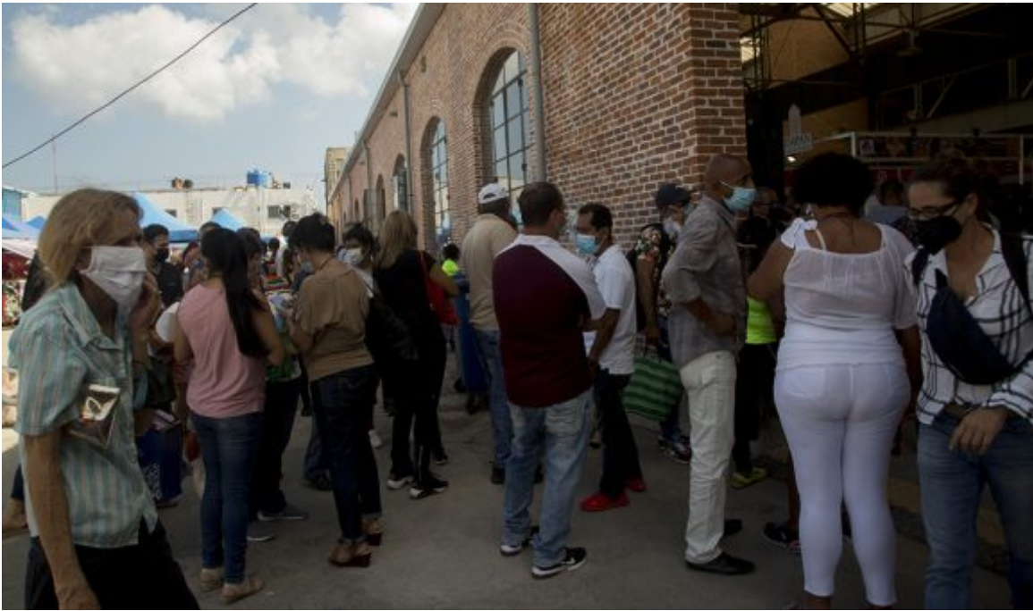
Feria de Linea y 18.

https://www.radiohc.cu/index.php/noticias/economia/287094-ministra-cubana-de-comercio-interior-intercambia-con-jovenes-trabajadores-del-sector-fotos