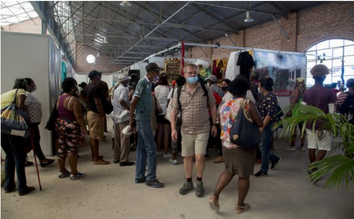
Feria de Linea y 18.