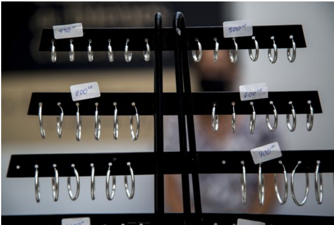
Feria de Linea y 18.