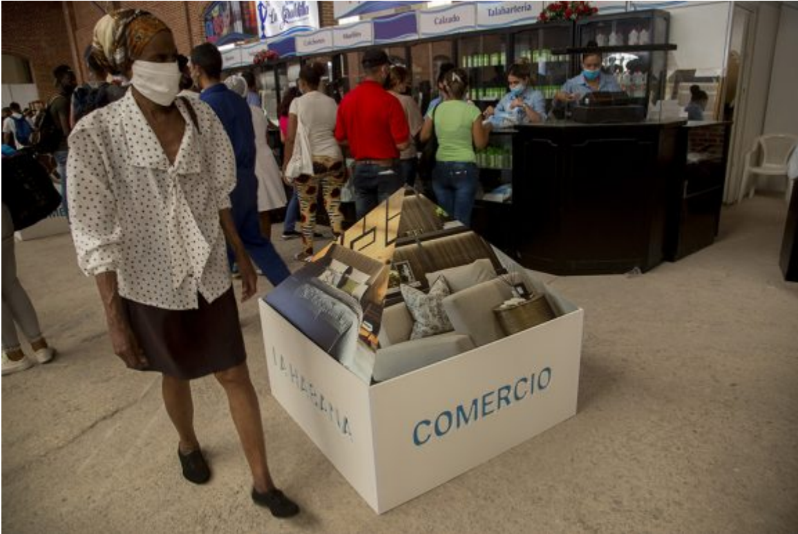
Feria de Linea y 18. Foto: Ismael Francisco. Cubadebate

Algunos jóvenes pidieron incrementar las opciones de superación en particular los cursos culinarios y de cantina.