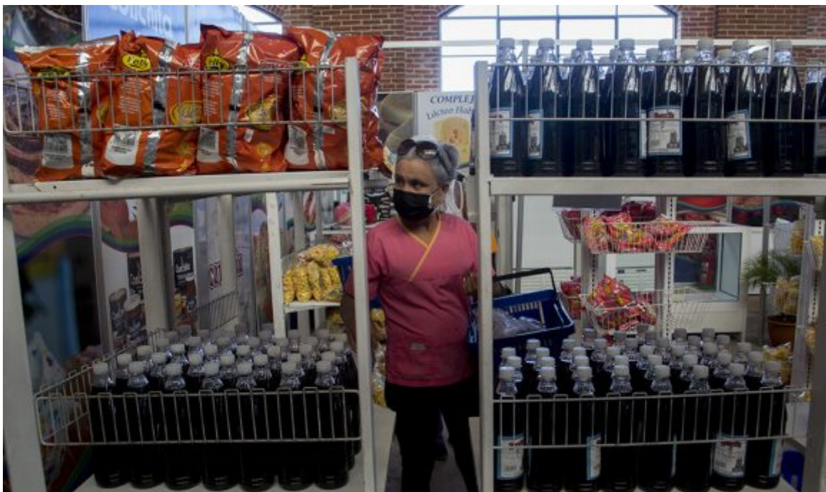
Feria de Linea y 18.