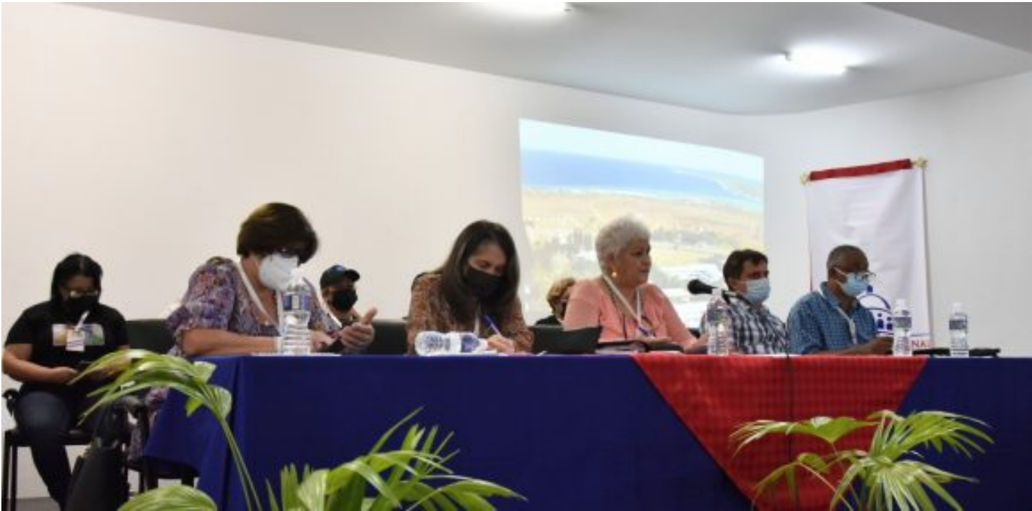
Taller Regional de Trabajo Comunitario Integrado de la región occidental del país.

En este sentido, reconoció que, de los 1 401 consejos populares, se realizaron talleres de TCI en 1 397 y presentaron sus experiencias 8 653 delegados. Destacó que se celebraron previamente los talleres municipales, donde fueron presentadas 1 811 ponencias.