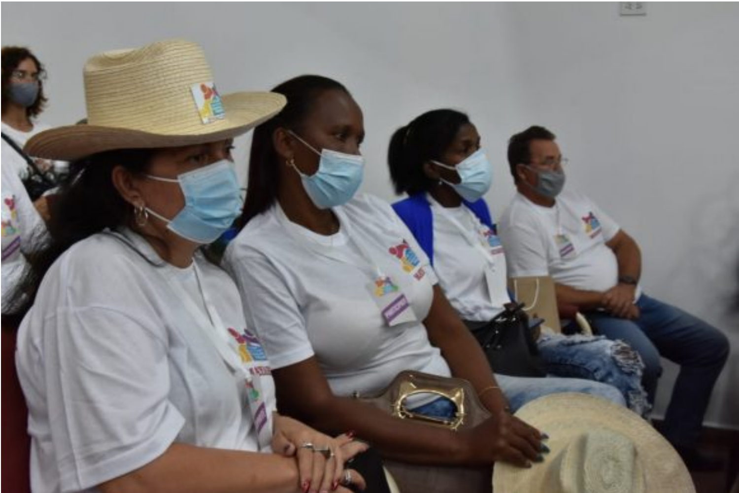
Taller Regional de Trabajo Comunitario Integrado de la región occidental del país.