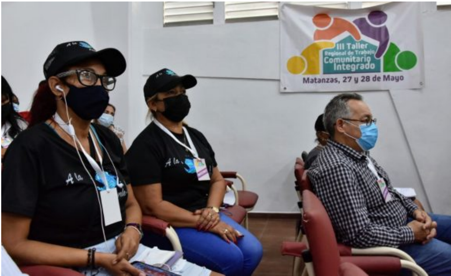
Taller Regional de Trabajo Comunitario Integrado de la región occidental del país.