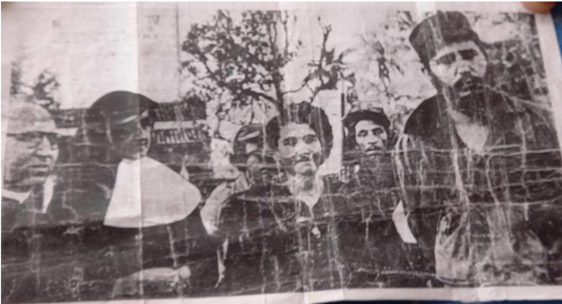
Ángel Fonseca junto a Fidel.

“Esos abuelos son cosa seria, lucharon en la Sierra y pertenecieron al cuerpo de seguridad del Comandante, les mostraré las imágenes –devela la joven con orgullo. Lo recibieron como a un nieto más, ‘mecaniqueaban’ los carros, pasaban horas y horas juntos”.