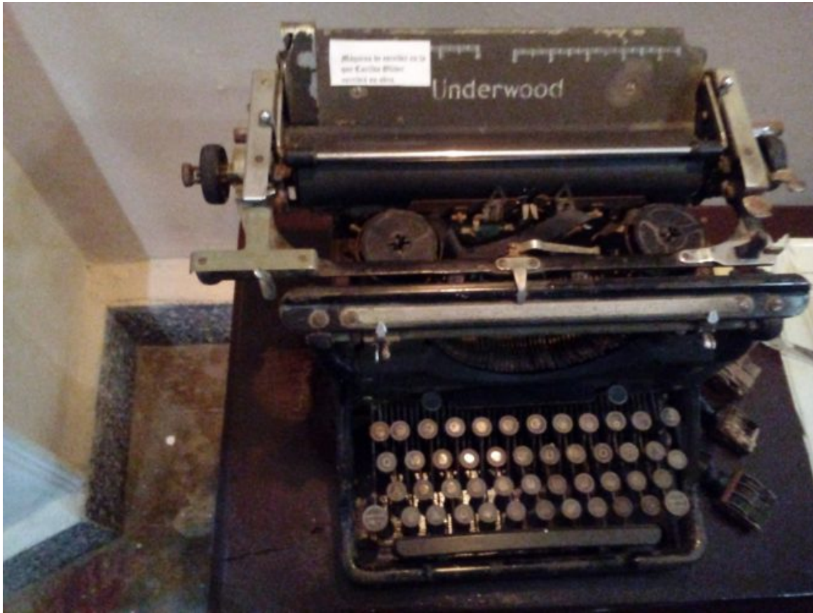
La máquina de escribir utilizada por Carilda.

También se exhiben adornos de su preferencia, juguetes favoritos de su infancia como una muñeca y un caballito, prendas familiares que atesoraba como reliquia patrimonial y más 200 fotos y diapositivas.