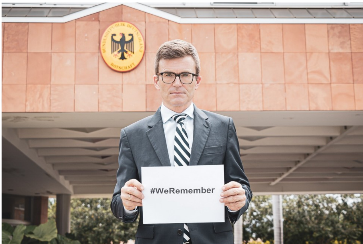
Embajador de Alemania en Brasil, Heiko Thoms.

Por el momento, el Ministerio Público de Santa Catarina abrió una investigación y alega que no hubo intención de apología al nazismo durante el acto frente al 14 Regimiento de Caballería Mecanizado, base del Ejército en la ciudad de San Miguel do Oeste.