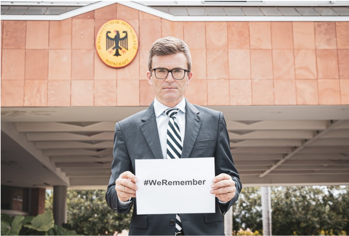
Embajador de Alemania en Brasil, Heiko Thoms.

Por el momento, el Ministerio Público de Santa Catarina abrió una investigación y alega que no hubo intención de apología al nazismo durante el acto frente al 14 Regimiento de Caballería Mecanizado, base del Ejército en la ciudad de San Miguel do Oeste.