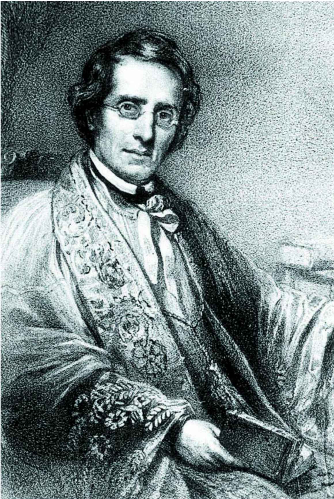
Félix Varela: sacerdote, maestro, escritor, filósofo y político cubano