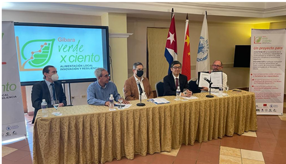
Presentación oficial de la iniciativa Verde x Ciento en Gibara, Holguín.

El proyecto cuenta con la intervención conjunta de dos entidades del sistema de las Naciones Unidas con larga experiencia en el acompañamiento a la gestión del sector agrícola y los sistemas alimentarios: el Programa Mundial de Alimentos (PMA) y el Fondo Internacional para el Desarrollo Agrícola (FIDA).