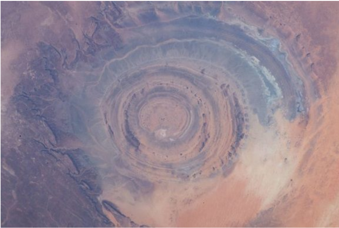
Imagen tomada durante la expedición 59 de la Estación Espacial Internacional (ISS, por sus siglas en inglés)

(Con información de RT y National Geographic en español)