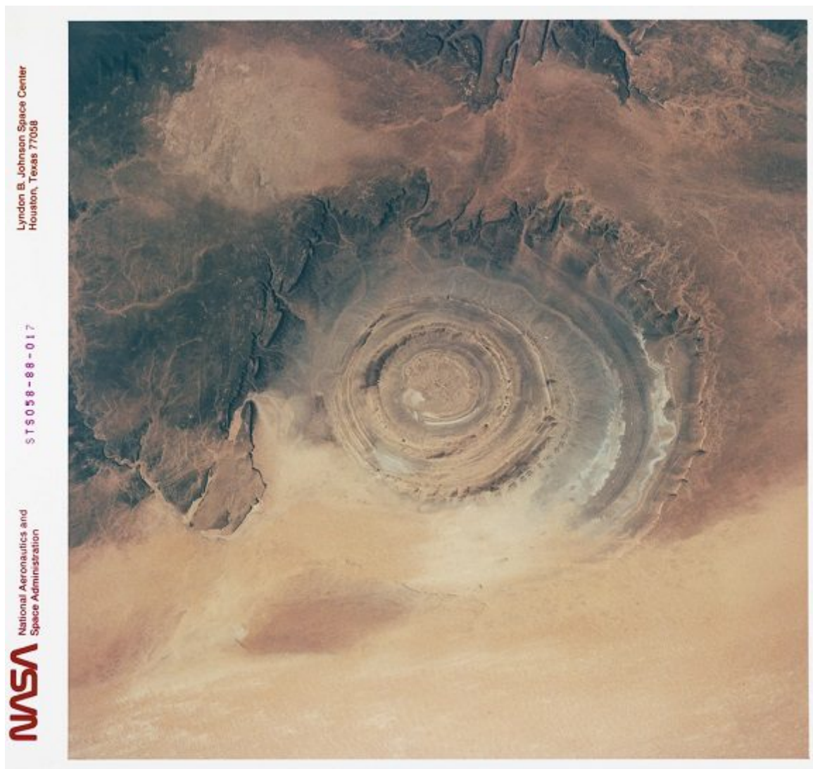
Vista aérea que muestra el 'ojo de buey' de la Estructura Richat, también conocida como 'Guelb er Richat', una cúpula geológica erosionada, que expone rocas sedimentarias en capas que parecen anillos

De hecho, el nombre oficial de este accidente geográfico es "Estructura de Richat". Se tiene registro de su existencia desde la década de los 60, cuando los astronautas de la expedición Géminis de la NASA como un punto de referencia. En aquel entonces, todavía se pensaba que había sido producto del impacto de un asteroide colosal.