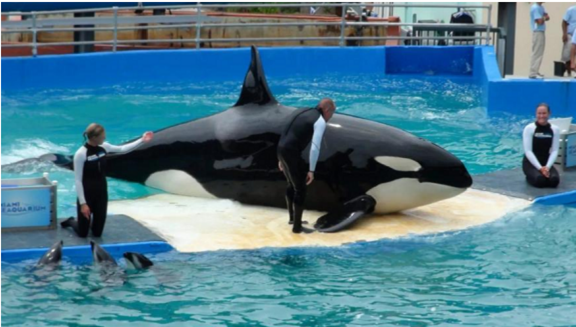
La orca 'Lolita' en plena actuación en el acuario de EEUU.

“Es un paso hacia la restauración de nuestro entorno natural, arreglando lo que estropeamos con la explotación y el desarrollo”, dijo el presidente de la junta del grupo de defensa Orca Network, Howard Garrett, a la agencia AP News. “Creo que estará emocionada y aliviada de estar en casa, en su antiguo vecindario”.