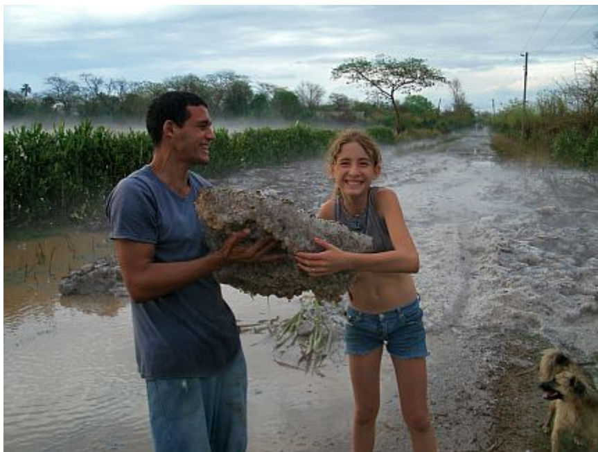
Granizada ocurrida en Las Lajas, municipio Calixto García, Holguín.

Un ejemplo ilustrativo es la ocurrida el 28 de mayo de 2011 en la provincia de Holguín, donde la cantidad de granizos sobre la superficie fue tal, que quedó fundida como una gruesa capa de hielo.