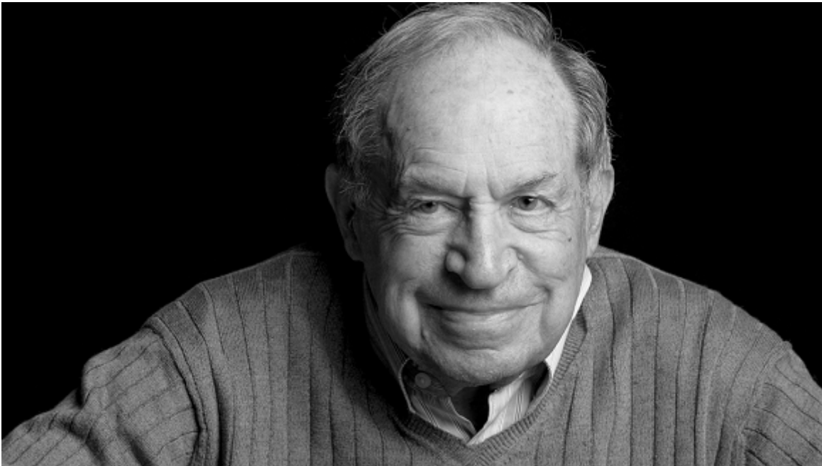
David Pines (1924 – 2018)

A pesar de que su teoría fue propuesta desde 1956, no había sido comprobada hasta ahora, pues la cuasipartícula hallada en el rutenato de estroncio metálico no contiene masa, es neutra y no interactúa con la luz, sino con el sonido. De acuerdo con los autores del artículo que anuncia que Pines estaba en lo correcto, el hallazgo llegó por accidente.