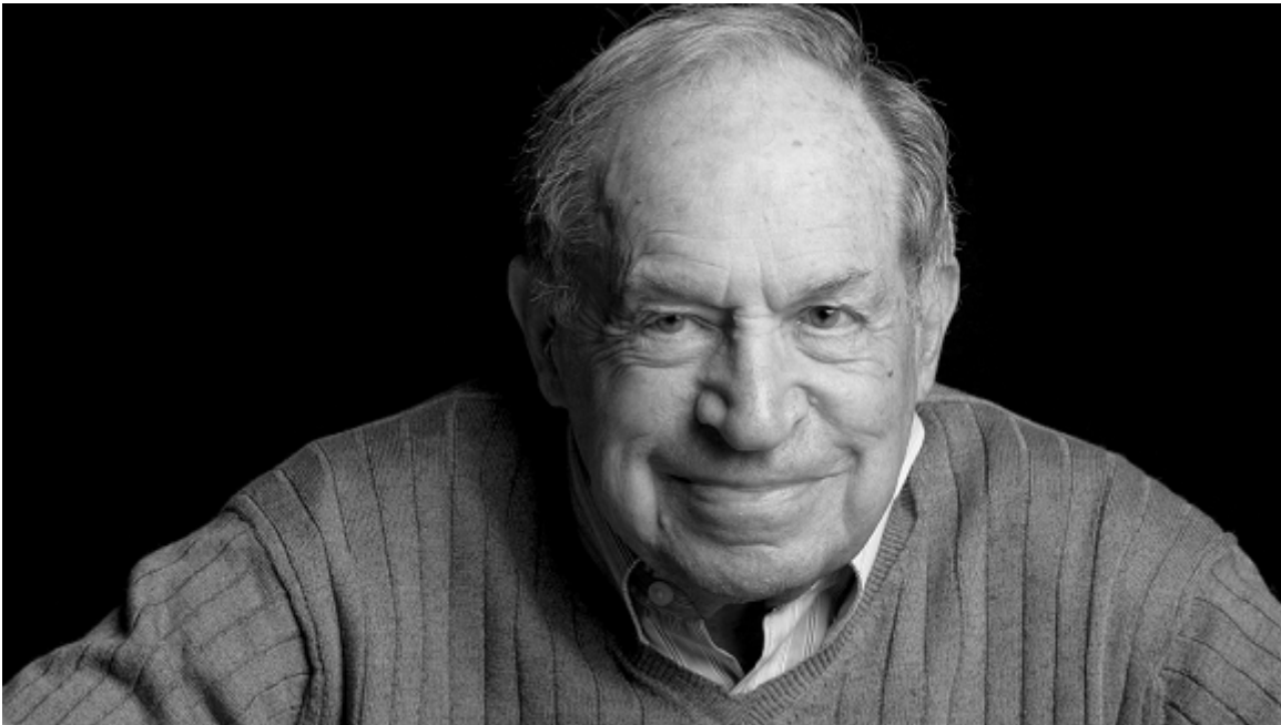
David Pines (1924 – 2018)

A pesar de que su teoría fue propuesta desde 1956, no había sido comprobada hasta ahora, pues la cuasipartícula hallada en el rutenato de estroncio metálico no contiene masa, es neutra y no interactúa con la luz, sino con el sonido. De acuerdo con los autores del artículo que anuncia que Pines estaba en lo correcto, el hallazgo llegó por accidente.