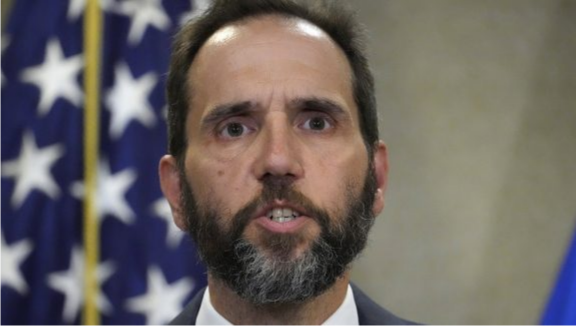
Jack Smith, fiscal especial de Estados Unidos.

Está previsto que el tribunal se reúna en privado el 5 de enero de 2024. No está claro si los jueces se reunirán antes para aceptar la solicitud de Smith.