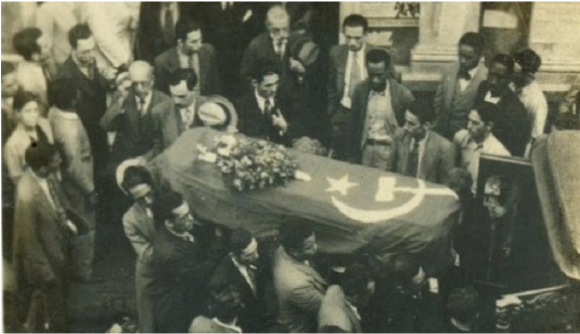
Sepelio de Villena.

[1] Samuel Feijóo: Cuarteta y Décima . Editorial Letras Cubanas, La Habana, 1980, p. 19