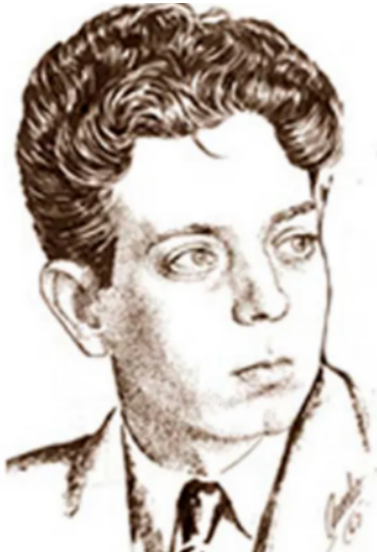
Rubén Martínez Villena