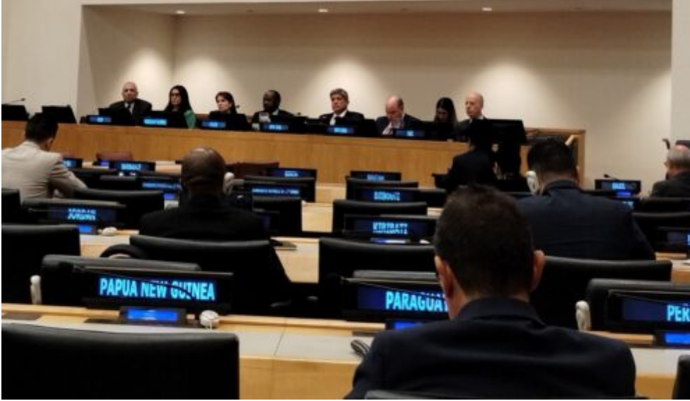
Organizada en nueve

capítulos, la investigación se centra en áreas como el comercio, la deuda externa, la agricultura y alimentación, la energía, el medio ambiente y la ciencia y la tecnología, adelantó el diplomático durante la presentación.