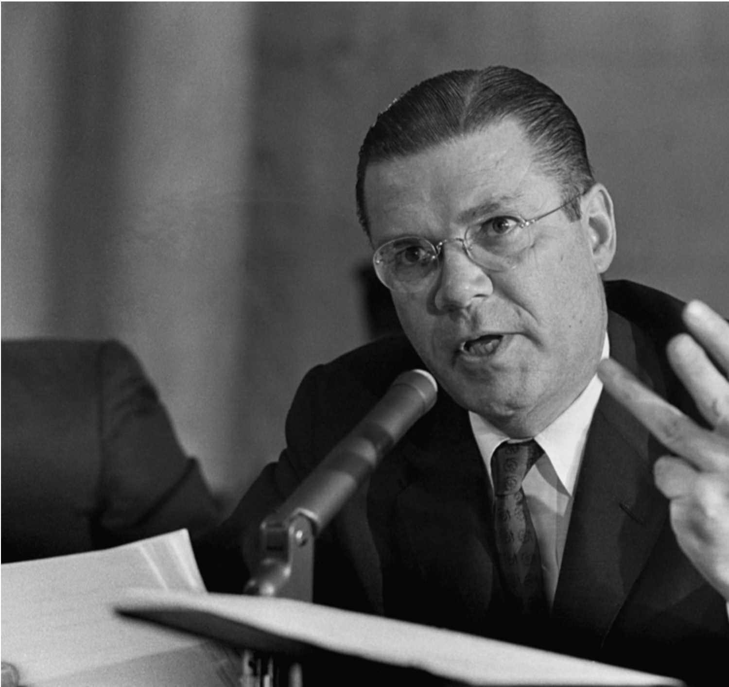
L'ancien secrétaire d'État américain Robert McNamara.

La proposition n'a pas été retenue, très probablement parce que Kennedy l'a rejetée. Pour comprendre les raisons du refus du président, il faut tenir compte, entre autres, du fait que 11 mois plus tôt, Washington avait dû supporter le coût de la défaite honteuse de l'incursion ratée de la Baie des Cochons, qui, bien qu'exécutée par des Cubains anticastristes, avait été ouvertement financée et soutenue militairement par les autorités américaines.