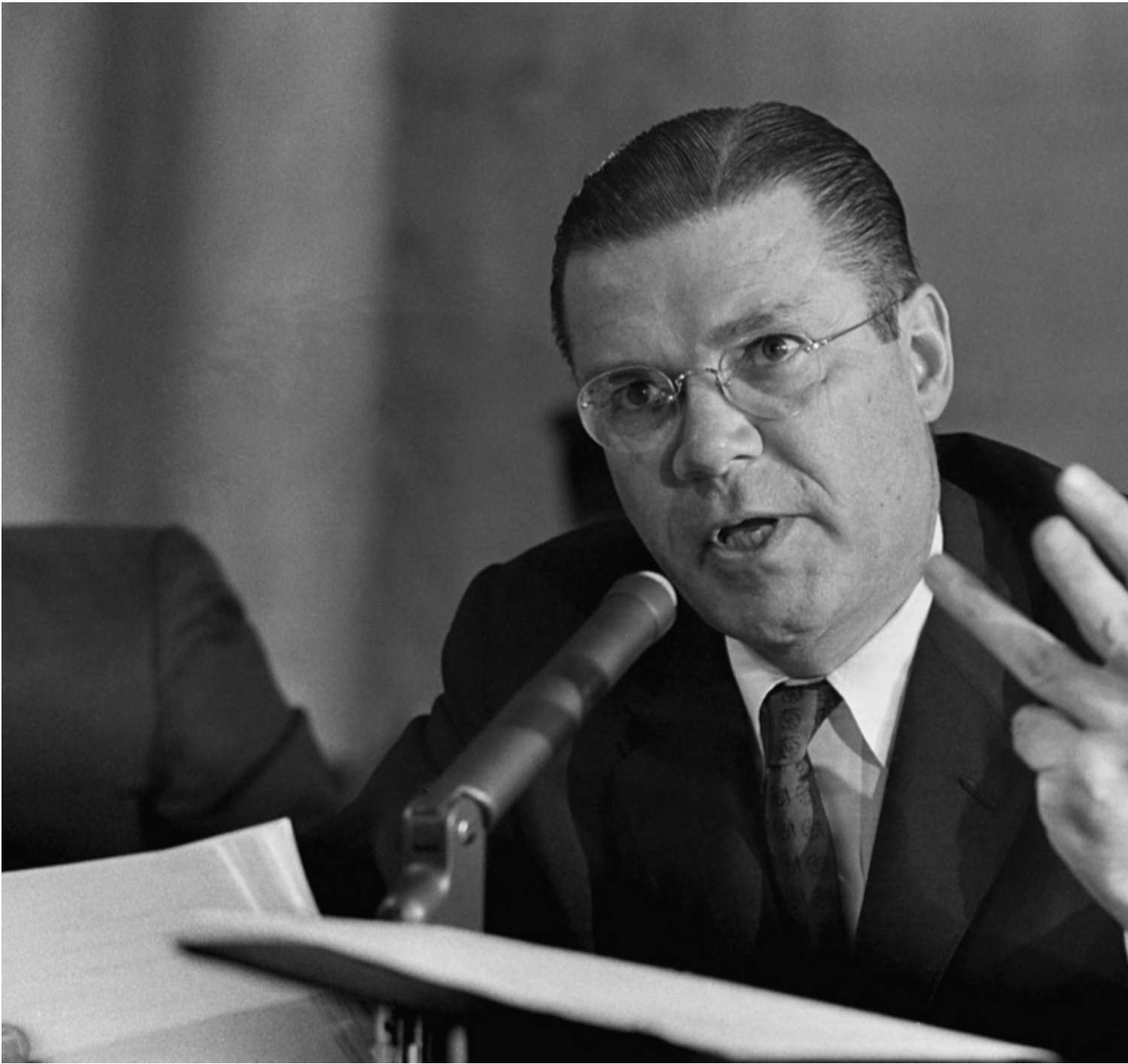
L'ancien secrétaire d'État américain Robert McNamara.

La proposition n'a pas été retenue, très probablement parce que Kennedy l'a rejetée. Pour comprendre les raisons du refus du président, il faut tenir compte, entre autres, du fait que 11 mois plus tôt, Washington avait dû supporter le coût de la défaite honteuse de l'incursion ratée de la Baie des Cochons, qui, bien qu'exécutée par des Cubains anticastristes, avait été ouvertement financée et soutenue militairement par les autorités américaines.