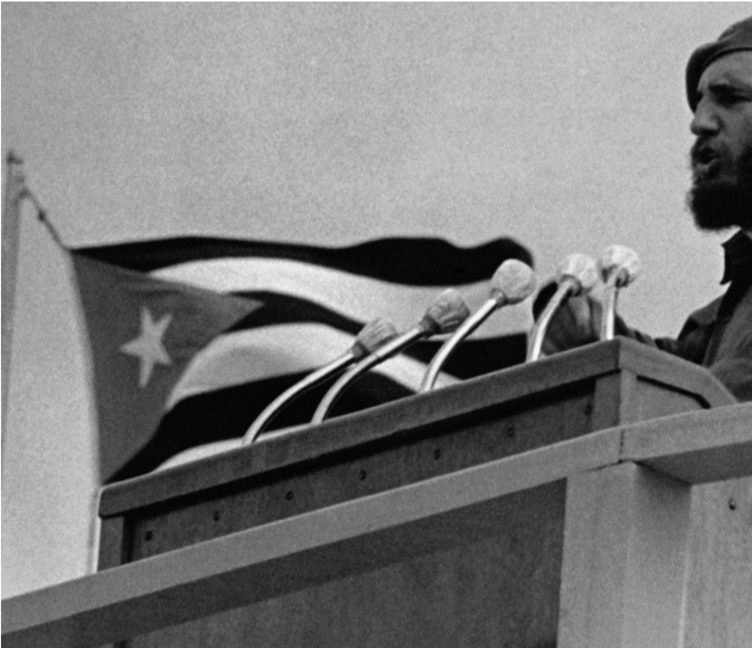
Le dirigeant cubain Fidel Castro dans les années 1960.

L'objectif déclaré de la simulation de tels événements était de créer « des incidents pour établir la plausibilité d'une attaque ». Ainsi, « les États-Unis réagiraient en exécutant des opérations offensives pour sécuriser l'approvisionnement en eau et en électricité et détruire les emplacements d'artillerie et de mortier menaçant la base », puis « lanceraient des opérations militaires américaines à grande échelle ».